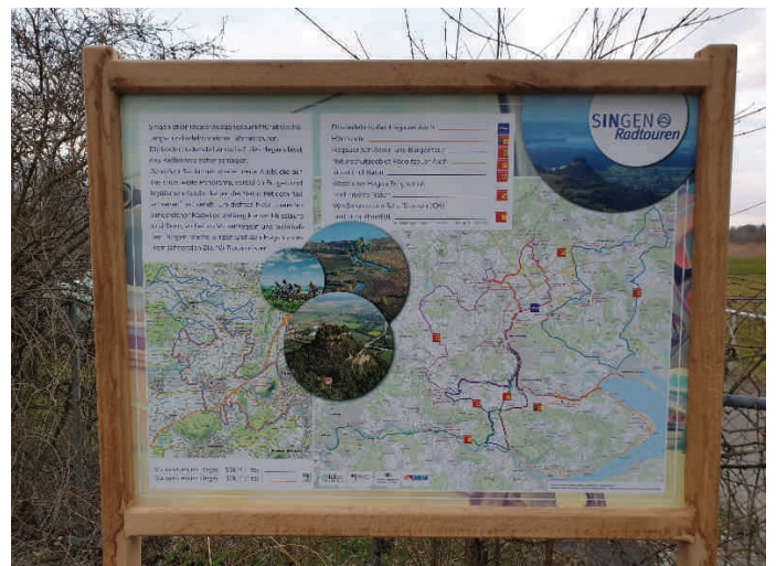
Aufgestellt am Bohlinger Sportlerheim, Ledergasse 54

Vor dem Gelände des SV Bohlingen wurde seitens der Stadt Singen ein Schild mit neuen Radtouren aufgestellt. Flußerlebnispfad, Hörirunde, Hegauer Schlösser u. Burgen, Naturschutzgebiet Radolfzeller Aach, Kunst u. Natur, Westlicher Hegau Burgruinen, Singen nach Schaffhausen und Reinfall sind die neuen ausgeschilderten Touren durch die Region.