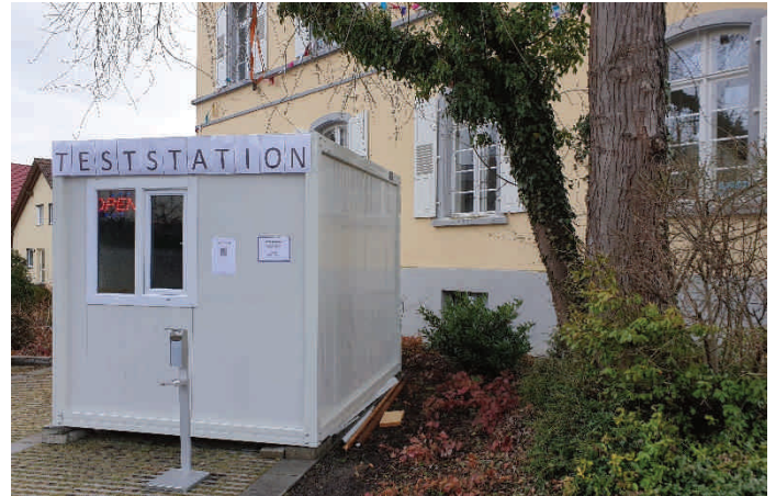
Corona-Schnellteststation am Rathaus

In Bohlingen am Rathaus wurde von einem privaten Betreiber eine Corona-Schnell-Teststation eingerichtet. Hier werden kostenlos im Rahmen der Bürgertests entsprechende Schnelltests angeboten. Diese steht allen Bürgern von Montag bis Samstag von 10.00 bis 18.00 Uhr und Sonntag von 13.00 bis 18.00 Uhr zur Verfügung. Nutzen Sie bei Bedarf dieses Angebot vor Ort.