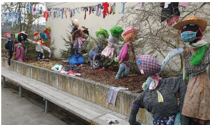
Gestaltet durch Förderverein Grundschule und Schüler