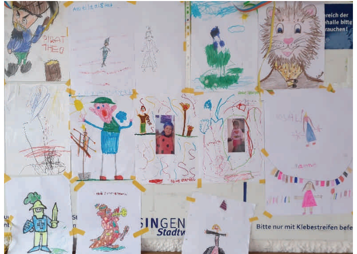
Kinderbilder der Dorfrallye an der Bushaltestelle