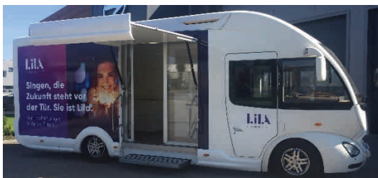
Info-Mobil von LilaConnect

Zudem steht ab sofort jeden Dienstag im März von 15:00-19:00 Uhr ein Info-Mobil der Firma LilaConnect auf dem Rathausplatz, um Fragen zu beantworten. Um unnötige Wartezeiten zu vermeiden, können Sie gerne vorab einen Termin auf der Verwaltungsstelle Bohlingen unter Telefon: 07731/22160 reservieren.