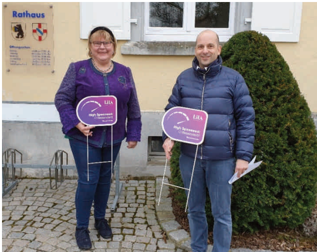
Startschuss für Glasfaseranbindung in Bohlingen

das politisch im Ortschaftsrat und bei Ihnen, den Bürgern, schon lange diskutierte Zukunftsthema mit schnellem Glasfaser-Internetanschluss kann in Bohlingen Realität werden. Die Firma LilaConnect möchte im gesamten Stadtgebiet und auf den Ortsteilen für jeden Haushalt einen kostenlosen Hausanschluss zur Verfügung stellen. Nach einer ersten Vermarktungsphase im nördlichen Stadtgebiet/Ortsteile sind nun die Südlichen Stadtteile/Ortsteile in der Vermarktungsphase. Voraussetzung für einen Anschluss ist jedoch, dass sich mindestens 40% der Haushalte im Vorfeld für ein Vertragsverhältnis im Rahmen der Erstvermarktung entscheiden. Hierzu plant LilaConnect ab sofort in Bohlingen bis Ende Mai 2022 tätig zu werden. Bis dahin hat jeder Haushalt die Gelegenheit, sich mit einem Servicemitarbeiter von LilaConnect in Verbindung zu setzen. Die Mitarbeiter kommen nach telefonischer Anmeldung gerne bei Ihnen zu einem persönlichen Termin vorbei und stehen für alle Fragen zur Verfügung.