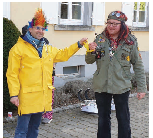
Narrenbaumstellen Schlüsselübergabe am Rathaus