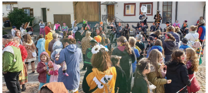
Dorffasnet am Narrenbrunnen