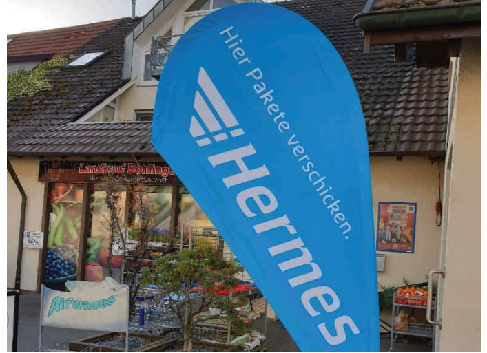
Neue Abholstation im Bohlinger „Landkauf“

In unserem Lebensmittelgeschäft „Landkauf“ in der Ledergasse 3 wird seit kurzem auch die Leistungen des Paketversandunternehmens „Hermes“ angeboten. Dort können Päckchen abgeholt und aufgegeben werden. Vielen Dank an Oliver Rothmund für die Übernahme dieser Dienstleistung.