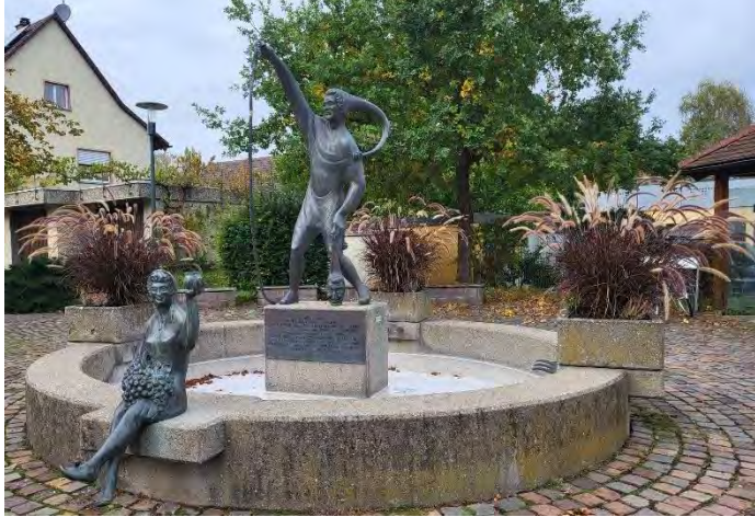
Herbstlich bepflanzter Narrenbrunnen

Das Zunft-Mitglied Florentine Böttinger sorgt das ganze Jahr für eine abwechslungsreiche Bepflanzung. Hierfür ein großes Dankeschön! Die Mittel für die Bepflanzung werden aus dem Ortsbudget zur Verfügung gestellt.