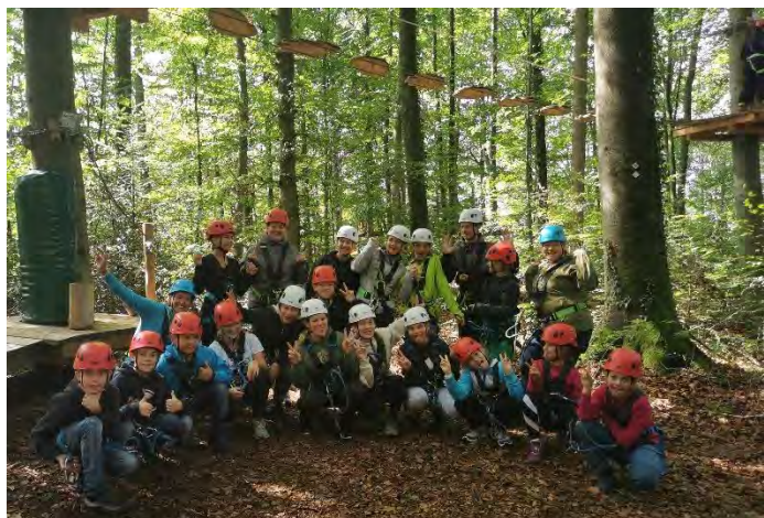
Jugendorchester im Kletterwald

Nachdem alle mit der entsprechenden Ausrüstung ausgestattet waren, gab es eine kurze Einweisung, dann konnte es endlich losgehen: Kletterparcours in unterschiedlichen Schwierigkeitsstufen wurden nach und nach unsicher gemacht.