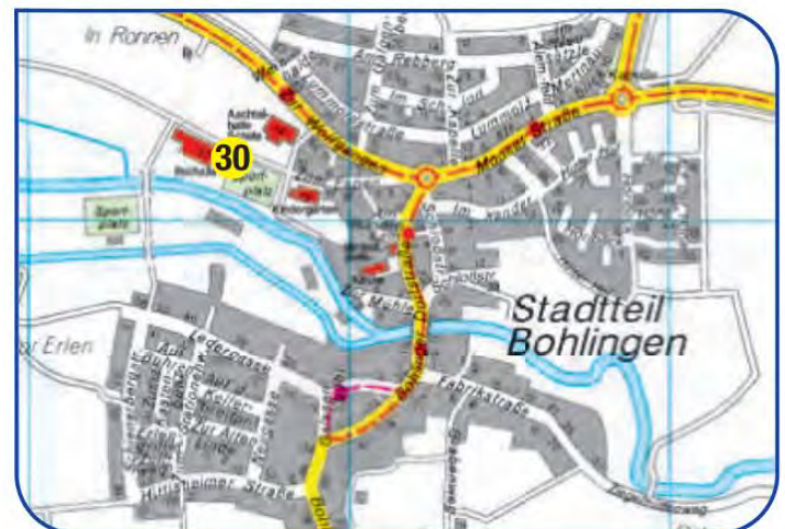
Standort „Zum Espen“ auf dem Parkplatz am Schulsportplatz

In den Ortsteilen befinden sich Wertstoffsammelplätze für Altglas und Kleidung. Die Behälter für Glas, Kleidung und Schuhe stehen Ihnen werktags von 7 bis 20 Uhr zur Verfügung. Außerhalb dieser Zeiten ist bitte eine Lärmbelästigung durch den Einwurf von Wertstoffen zu vermeiden.