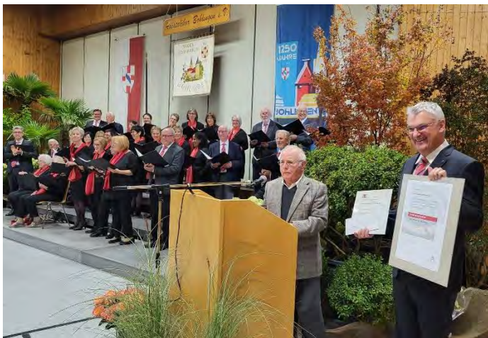
Übergabe der Jubiläumsurkunden

Am Sonntag, 22. Oktober 2023 fand das Konzert des Achtalchores anlässlich der 1250 Jahr Feier von Bohlingen und dem 100jährigen Bestehen des Vereins statt.