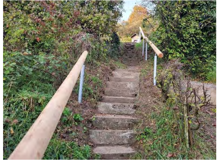
Neue Treppengeländer am Aufstieg zum Galgenberg

In den letzten Tagen wurden und werden noch die zum Teil morschen Geländer bei den Aufstiegen zum Galgenberg erneuert. Ebenso wurden die Wege wieder freigeschnitten, damit eine bessere Begehbarkeit gewährleistet ist. Ein herzliches Dankeschön an die Abteilung Technische Dienste der Stadt Singen.