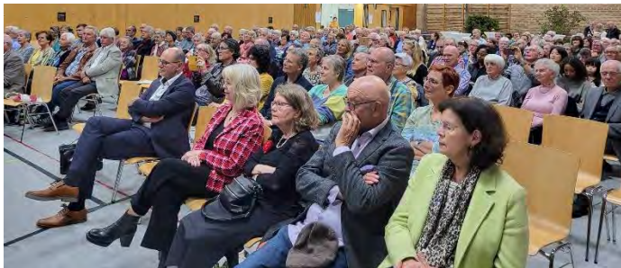
Vollbesetzte Stuhlreihen zum Jubiläumskonzert