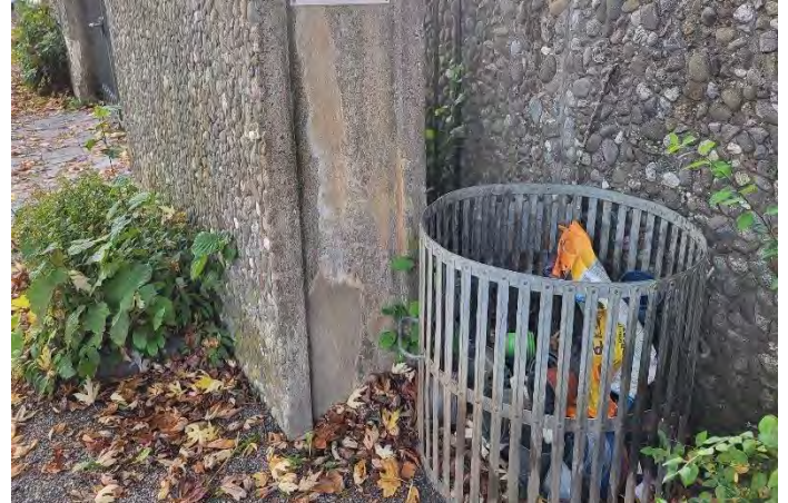
Abfallbehälter am Haupteingang Friedhof

Der Behälter neben dem Haupteingang ist ausschließlich für Grablichter und Plastikabfälle angelegt. Hier bitte KEINE Hundekotbeutel oder Bio-Abfälle wie Gras, Erde, Blumen usw. ablegen!