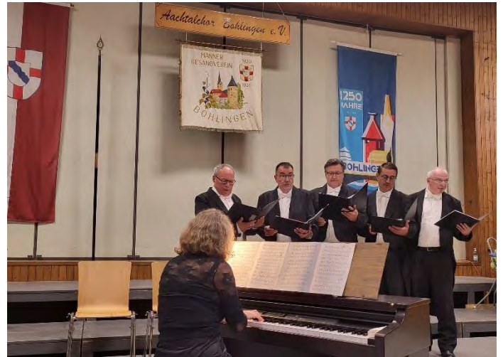
Männerbesetzung als Comedian Harmonists

Die über 200 Gäste in der Aachtalhalle waren begeistert von dem kurzweiligen Programm der Sängerinnen und Sänger und der Original-Männerbesetzung mit Liedern der Comedian Harmonists.