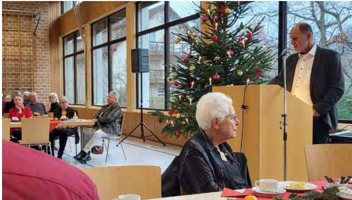
Oberbürgermeister Bernd Häusler bei der Seniorenfeier 2022

Neben Kaffee und Kuchen, Zopf und kalten Getränken dürfen wir Sie auch noch zu einem Abendessen einladen.