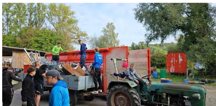
1. und 2. Fußballmannschaft bei der Schrottsammlung

der Förderverein SV Bohlingen e.V. möchte sich hiermit bei Ihnen allen für Ihre Schrottspenden bedanken. Bei der Schrottsammlung am 30. September 2023 konnte durch Ihr zutun ein beachtlicher Betrag für die Fußballjugend des SV Bohlingen gesammelt werden.