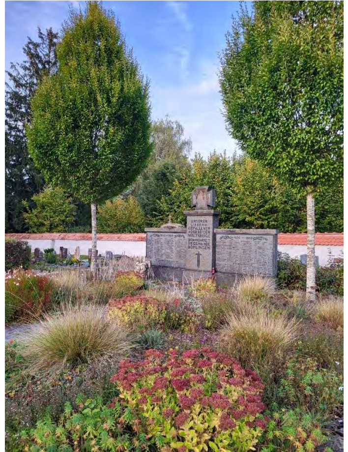
Kriegerdenkmal auf dem Bohlinger Friedhof

Nehmen Sie sich für die Mahnung und den Ruf nach Frieden kurz diese 20 Minuten Zeit und zeigen Sie durch Ihr Kommen Anteil am Schicksal der vielen Toten in der heutigen Zeit!