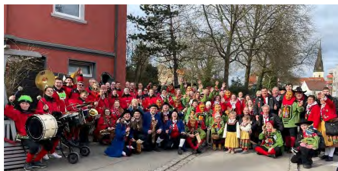
Beim Kinderumzug am Fasnachts-Samstag 2023

Für heiße und kalte Getränke sowie einen kleinen Snack ist gesorgt. Alle Zunftmitglieder sind eingeladen, in ihrem Häs zu kommen.