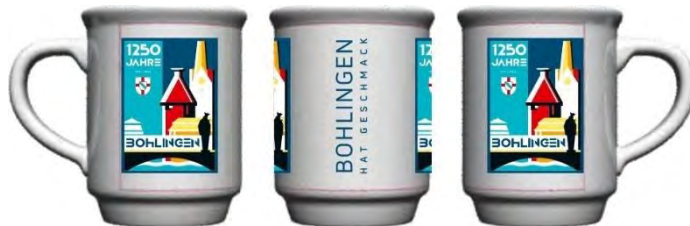
Glühweintassen für den Christkindelmarkt 2023

Auf dem Weihnachtsmarkt werden zudem noch schöne Geschenkartikel im WGH angeboten und anlässlich der 1250 Jahrfeier gibt es Jubiläumstassen für leckeren Glühwein zu kaufen.