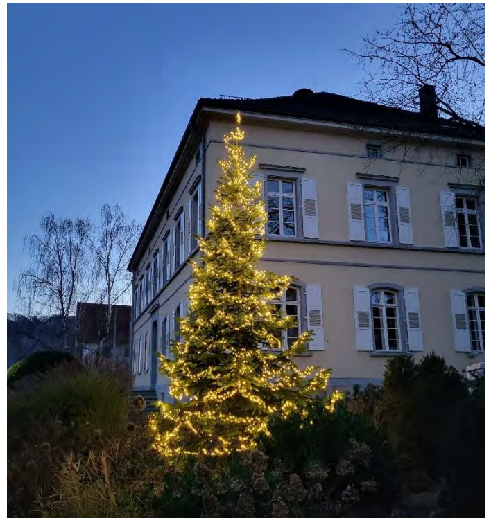
Beleuchteter Weihnachtsbaum vor dem Rathaus Weihnachten 2022

Auch in diesem Jahr wird es wieder einen beleuchteten Weihnachtsbaum am Bohlinger Rathaus geben. Pünktlich zum 1. Advent und dem Christkindelmarkt in Bohlingen am Samstag, 2. Dezember 2023 wird dieser vor dem Rathaus leuchten. Der diesjährige Weihnachtsbaum wird von Andreas Zimmermann vom Hotel Restaurant Zapa zur Verfügung gestellt. Herzlichen Dank hierfür schon im Voraus.