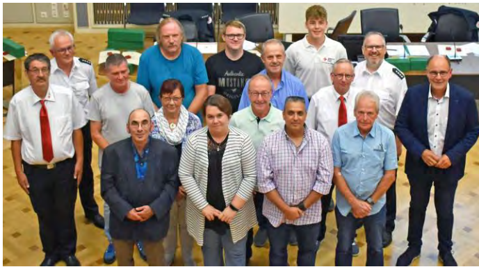
Geehrte Blutspender der Stadt Singen und Ortsteile

„Für einen älteren ausscheidenden Dauerspender müssen drei Neuspender gewonnen werden, um das Gesamtvolumen des gespendeten Blutes zu halten“, informierte der OB. Immerhin sei es erfreulich, dass im Landkreis Konstanz die Zahl der Erstspender im vergangenen Jahr in etwa gehalten werden konnte.