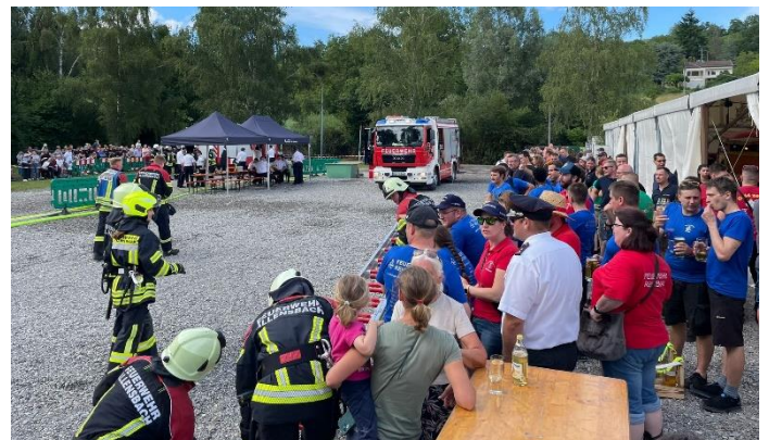
Wettkampfstrecke am Festzelt

Fast allen gelang an diesem Tag auch das Bestehen der Wettkämpfe. Für diejenigen, denen es nicht gelang, gab es am darauffolgenden Freitag nochmals die Chance zur Wiederholung.