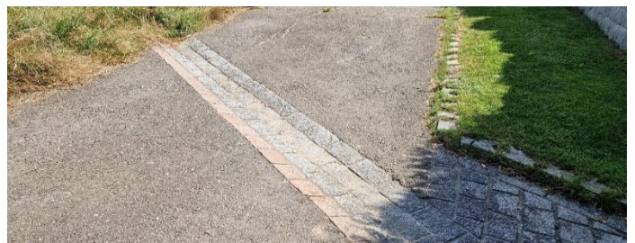
Steinrinne zum ableiten Oberflächenwasser

Der anschließende Graben, der entlang des Pfeffnangweges bis zur Antoniuskapelle und dann in das zweite Regenüberlaufbecken gegenüber mündet, wurde ebenfalls ertüchtigt und ausgemäht. Zudem sollen auf dem Pfeffnangweg noch zusätzliche gepflasterte Querrillen analog an der Kapelle in Richtung Stationenweg angebracht werden. Dadurch soll auf dem Weg fließendes Wasser in den Graben abgeleitet werden.