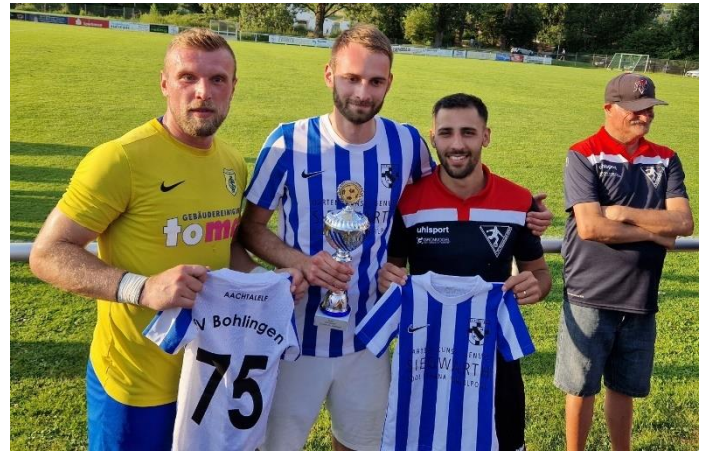
Bei der gemeinsamen Siegerehrung

Über 300 Zuschauer verfolgten die Spiele und kamen in den Genuss des kulinarischen Angebots von verschiedenen Speisen, Getränken und leckerem Eis.