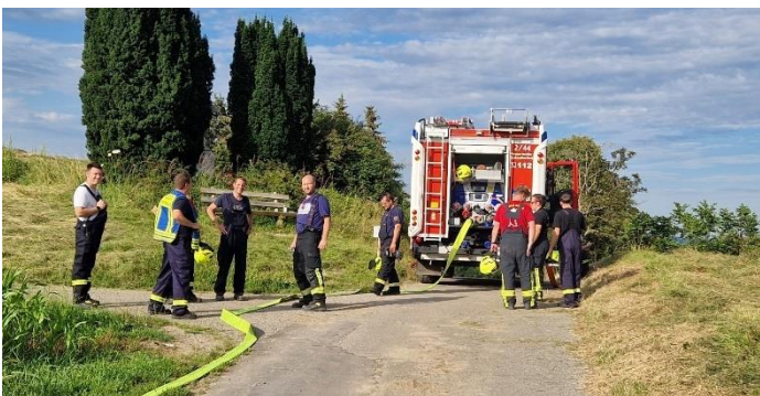
Verlegung der 4 km langen Schlauchleitung