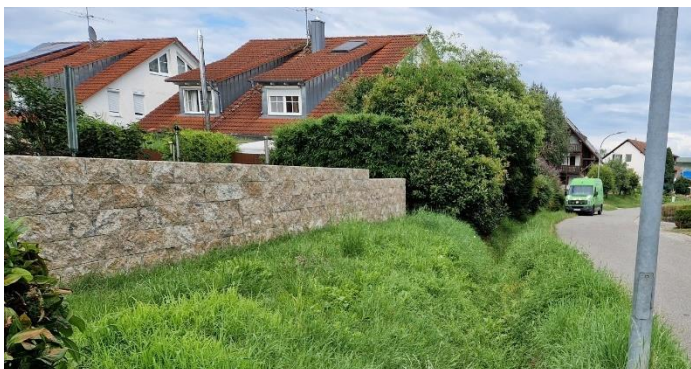
Graben in der Hittisheimer Straße

Angesichts des aktuellen Überflutungsereignisses, bei der sich eine Schlammlawine über die komplette Bohlinger Dorfstraße den Weg bahnte, erinnerten einige Bürger nochmals an das Überschwemmungsereignis aus dem Jahr 2013 in der Hittisheimer Straße. Damals waren einige Häuser sowie das Restaurant Zapa betroffen. Aus diesem Grund ist es wichtig, dass der Graben in der Hittisheimer Straße regelmäßig von den Technischen Diensten ausgemäht und ausgebaggert wird, um im Falle von Starkniederschlag das Wasser ordnungsgemäß über den Graben in das Leitungsnetz abführen zu können. Die Verwaltung ist sensibilisiert und wird das regelmäßig überwachen. Gerne dürfen Sie aber auch als Bürger eine entsprechende Meldung an die Verwaltungsstelle geben.