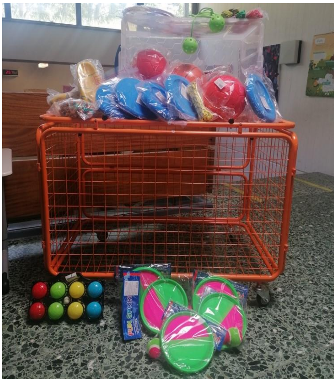
Gitterbox mit Sportspielen

Zusätzlich wurden Gesellschaftsspiele und Tischtennisschläger für die Kinder, welche die Betreuung der zuverlässigen Grundschule besuchen, angeschafft.