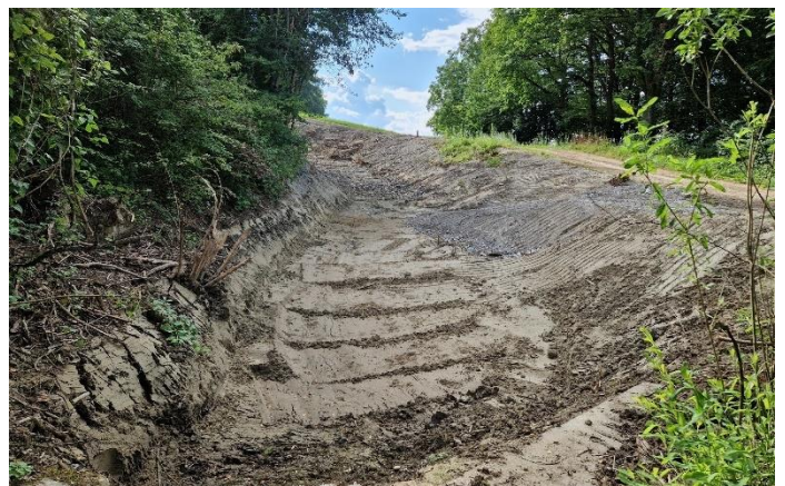
Ausgebaggertes Geröllfangbecken am Ende der Bohlinger Schlucht

Der anschließende Graben, der entlang des Pfeffnangweges bis zur Antoniuskapelle und dann in das zweite Regenüberlaufbecken gegenüber mündet, wurde ebenfalls ertüchtigt und ausgemäht. Zudem sollen auf dem Pfeffnangweg noch zusätzliche gepflasterte Querrillen analog an der Kapelle in Richtung Stationenweg angebracht werden. Dadurch soll auf dem Weg fließendes Wasser in den Graben abgeleitet werden.