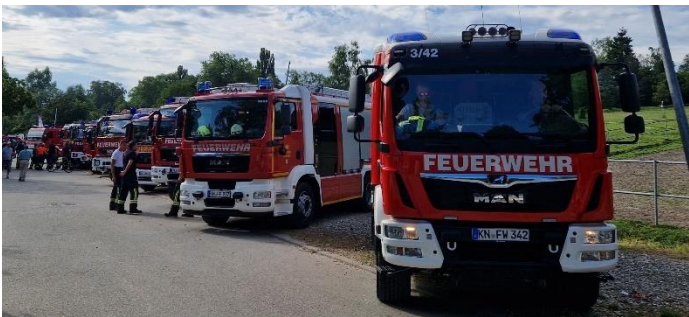
Feuerwehren am Festplatz vor der Probe

Die „Längste Schlauchleitung im Hegau“: „Von der Ach bis zur Blattform“ bot am Montagabend nochmal ein Spektakel durch das halbe Dorf.