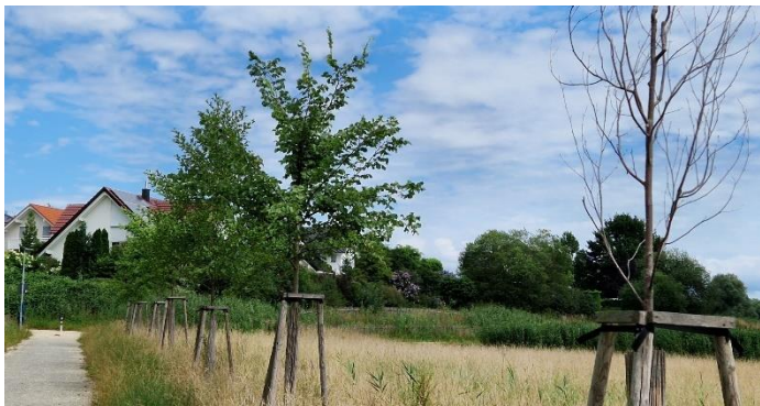
Abgestorbene Bäume am Verbindungsweg

Am Verbindungsweg Schloßstraße - Hörblick sind zwei Bäume abgestorben. Diese werden im Herbst durch eine Neupflanzung ersetzt. Frau Beate Toniolo hat auf der Ortsverwaltung vorgeschrieben und möchte diese zwei neuen Bäume gerne spenden. Ein herzliches Dankeschön hierfür schon im Voraus!