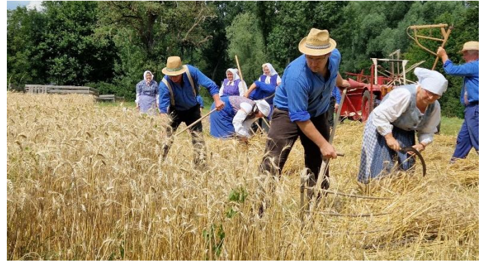
Traditionelles Mähen mit Sense