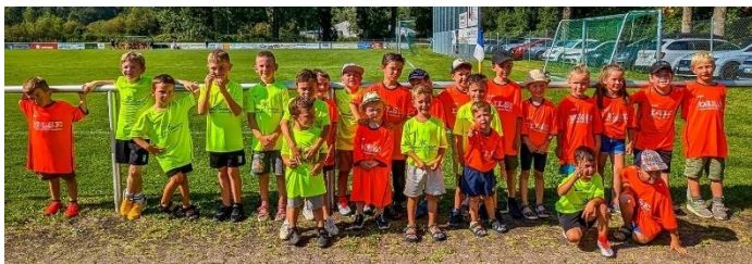
Einlaufkinder des SV Bohlingen

Somit teilten sich die Gäste aus Rielasingen und Singen am Ende Punkt- und Torgleich den ersten Platz und übergaben den Siegerpokal symbolisch zurück an den Ausrichter.