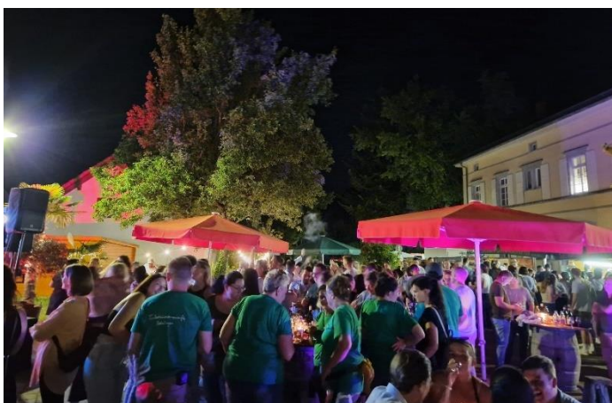
Voller Kirch- und Rathausplatz bis spät in die Nacht

Der Freitagabend hatte die besten Voraussetzungen: Kühlen Wein, gutes Essen und vor allem eine klasse Musik. Mit der Liveband Audio hatten wir vermutlich direkt ins Schwarze getroffen. Die jungen Vollblut-Musiker aus dem Raum Rottweil hatten dem mittlerweile zu einer stattlichen Größe herangewachsenen Weinfest einfach die Krone aufgesetzt. Generell hatten Musik, Speis und Trank und die Deko wieder dafür gesorgt, dass das Bohlinger Weinfest das ist, was es immer sein sollte: Ein gemütliches Sommerfest mit Ambiente fürs Dorf und die Umgebung.