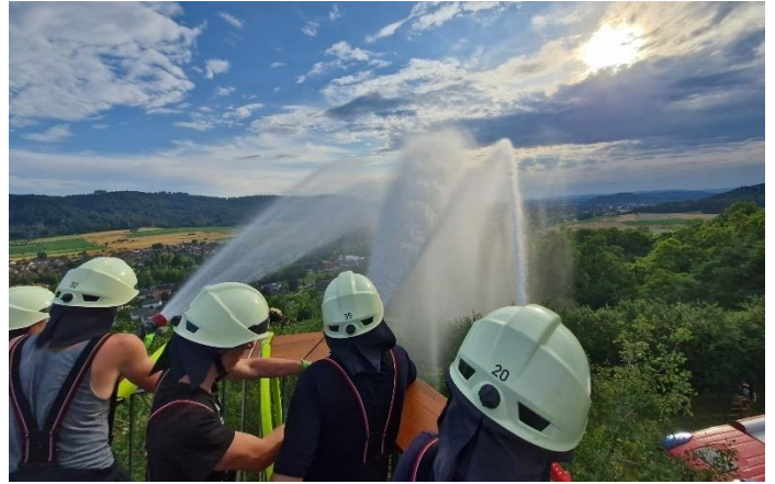
Wasser Marsch von der „Blattform“