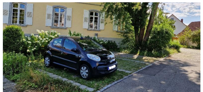
Zukünftig dürfen hier nur noch städtische Fahrzeuge parken

Die drei Parkplätze an der Nordseite des Rathauses werden zukünftig nicht mehr für die Öffentlichkeit zur Verfügung stehen, sondern ausschließlich den Dienstfahrzeugen des Rathauses vorbehalten sein. Zum einen wird dort ein Parkplatz für das Fahrzeug des Försters eingerichtet. Ebenso soll der neu angeschaffte Bürgerbus dort parken. Der dritte Stellplatz ist der Ortsverwaltung vorbehalten und soll später einmal der Parkplatz für ein mögliches Car-Sharing Fahrzeug sein. Eine entsprechende Beschilderung wird in den nächsten Wochen angebracht werden.