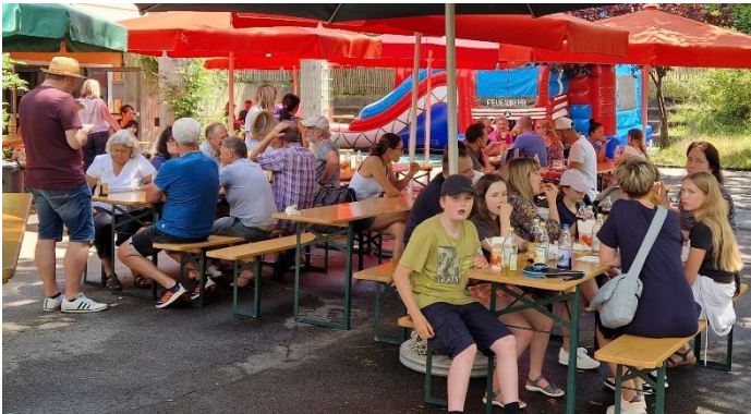
Bewirtung der Gäste