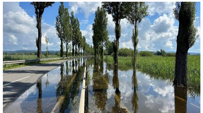
Hochwasser auf der Straße Moos-Radolfzell

Zudem muss der öffentliche Nahverkehr auf die Höri bzw. nach Radolfzell deutliche längere Fahrtzeiten in Kauf nehmen. Die Rettungskräfte, welche von Radolfzell auf die Höri fahren, haben ebenfalls deutlich längere Anfahrtswege, was in einigen Fällen ggf. zum Nachteil von Patienten ist bzw. damit die gesetzlich vorgeschriebenen Zeiten für eine Anfahrt von Rettungskräften nicht mehr gewährleistet werden kann.