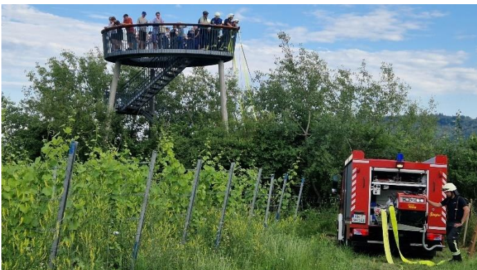
Zuschauer auf der „Blattform“