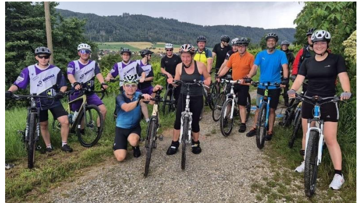
Teilnehmer „Fit for Firefighting“

Vom pünktlich mit Beginn des Events „Fit for Firefighting“ beginnenden Regens ließ sich niemand der Teilnehmenden beeindrucken – im Einsatzfall bleibt man bei Regen schließlich auch nicht daheim. Mit guter Laune und in bester Gesellschaft wurde Bohlingen zu Rad und Fuß erkundet.