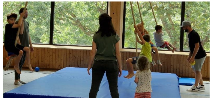
Kinder in der Aachtalhalle beim Bewegungs-Parcours

Am Sonntag, 21. Juli 2024 bot sich der Bohlinger Bevölkerung bei einem Sporttag rund um die Schule und in der Aachtalhalle an, die verschiedenen Sportarten des Vereins Fußball, Tischtennis, Volleyball, Gymnastik, Kinderturnen, Boule kennenzulernen und selbst auszuprobieren. Viele Gäste über den Tag verteilt nutzten die aufgebauten Stationen und betätigten sich sportlich daran.