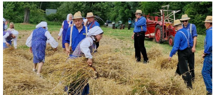
Feldarbeit wie früher