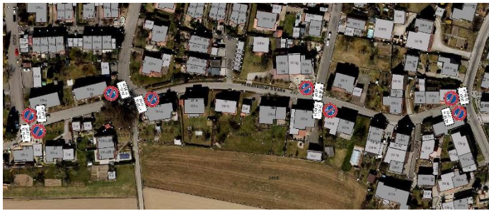
Eingeschränktes Halteverbot in der Hittisheimer Straße

größere landwirtschaftliche Fahrzeuge sonst nicht auf die entsprechenden Ackerflächen Richtung Hittisheim. Wir bitten um Verständnis für diese Maßnahme.