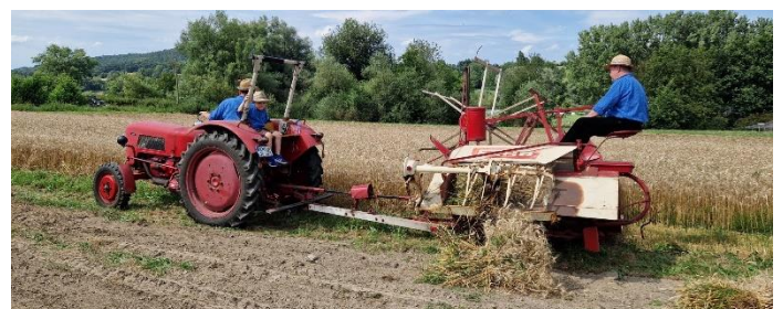
Bindemäher aus den 1950er Jahren im Einsatz

Auch ein Fahr Bindemäher aus den 1950er Jahren kam zum Einsatz und zeigte die deutliche Arbeitserleichterung der bis dato durchgeführten Handarbeit auf.