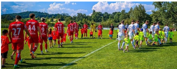
Partie gegen 11. FC Rielasingen-Arlen