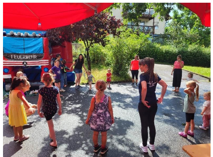
Tänze der Kinder