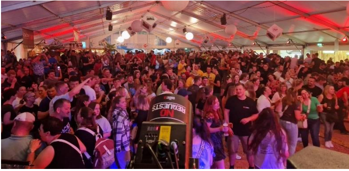
Volles Zelt bei der Froschenkapelle

Der Aktionstag am Sonntag rund um das Festzelt lockte mit Hüpfburg und allerlei besonderen Fahrzeugen der unterschiedlichsten Organisationen viele Familien an.