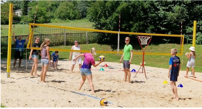
Auf dem Beachvolleyballfeld