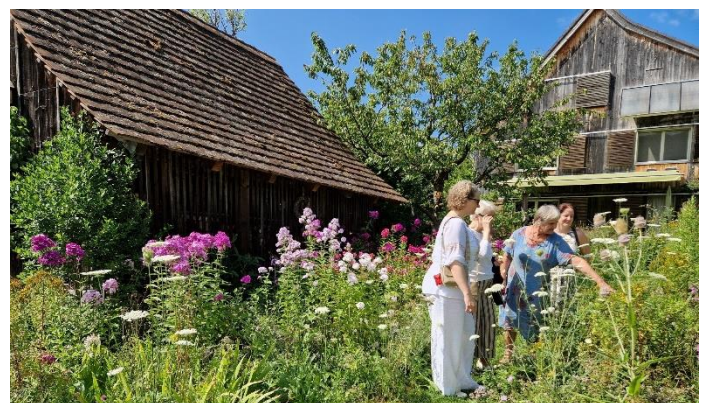
Besucher des Naturgarten

Am Sonntag, 28. Juli 2024 war der Naturgarten von Sibylle Möbius geöffnet. Einige interessierte Besucher haben sich die Blühpflanzen und das dahinterstehende Konzept für die Insekten und Wildbienen erklären lassen.