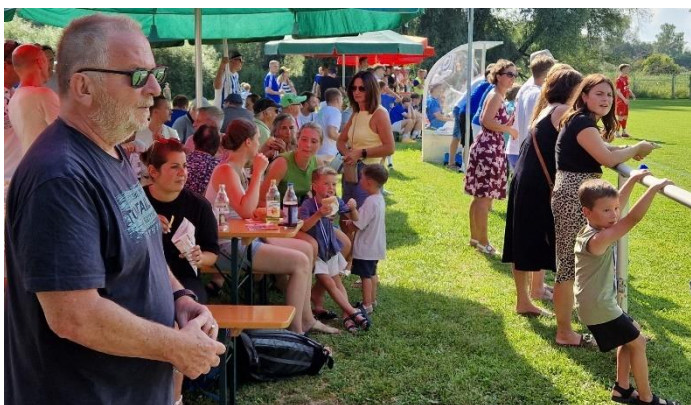
Zahlreiche Zuschauer säumten das Spielfeld

Über 300 Zuschauer verfolgten die Spiele und kamen in den Genuss des kulinarischen Angebots von verschiedenen Speisen, Getränken und leckerem Eis.