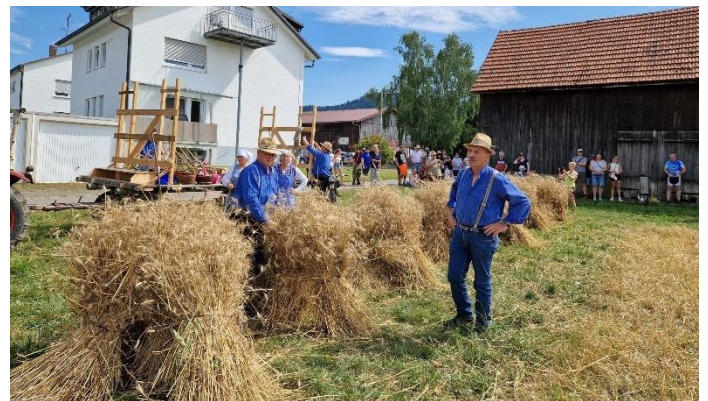
Aufstellung der Weizengarben zum Trocknen

Auch ein Fahr Bindemäher aus den 1950er Jahren kam zum Einsatz und zeigte die deutliche Arbeitserleichterung der bis dato durchgeführten Handarbeit auf.