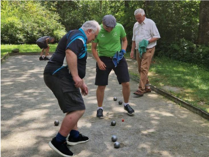
Spieler auf der Bouleanlage