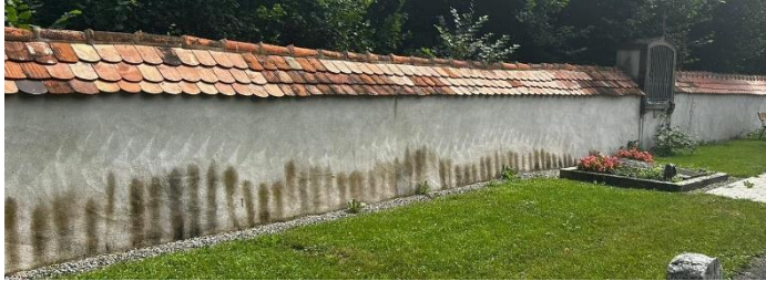
Verschmutzung an der Friedhofsmauer

Was der Grund für die starke Verschmutzung der Friedhofsmauer ist, soll in einem Vorort-Termin mit dem Friedhofsamt und mit dem Bauamt der Stadt Singen unter Einbezug der Denkmalpflege erörtert werden.