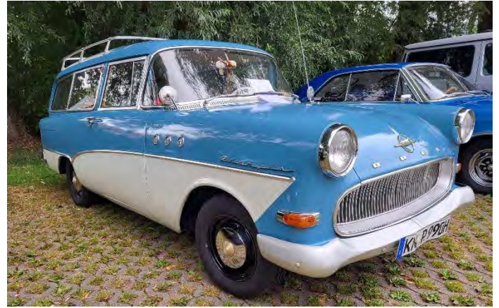
Oldtimertreffen am Samstag