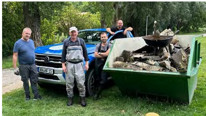
1,4 Tonnen Müll aus der Aach gesammelt

Es ist mit Sicherheit nicht der ganze Müll absichtlich durch Menschenhand verursacht, aber man erkennt schon, was die Menschen unbedacht oder gleichgültig für die Folgen der Tiere und der Pflanzen, achtlos in dem Gewässer entsorgen. Das macht einen schon wütend, dies jährlich mit anzusehen. Es ist kaum vorstellbar, was im Stadtbereich an Müll zusammenkommt, wo noch viel mehr auf diese Weise entsorgt wird.