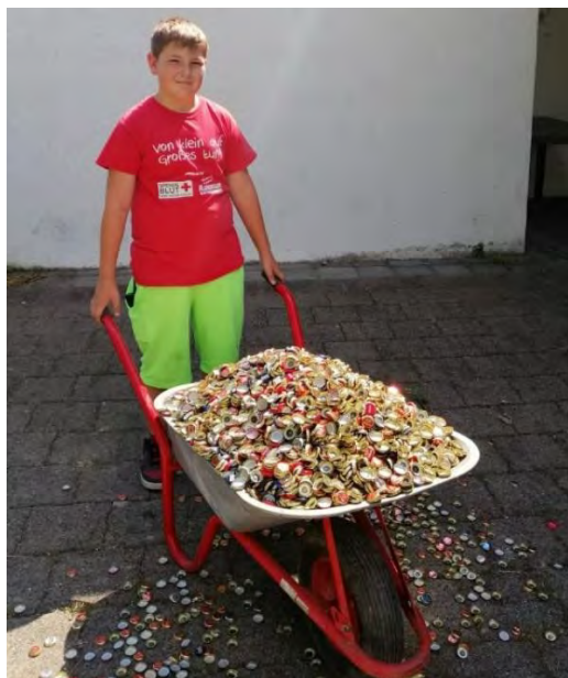
7.000 Kronkorken in der Schubkarre

Der Schützenverein Bohlingen hat es geschafft und das Flaschengeld-Projekt der Badischen Staatsbrauerei Rothaus erfolgreich beendet. Durch das Sammeln von 7000 Kronkorken und Eingeben der achtstelligen Codes konnte unser Projekt "Anschaffung eines Laserlichtgewehrs" für die Kinder- und Jugendarbeit aus dem Rothaus-Fördertopf endgültig finanziert und angeschafft werden.