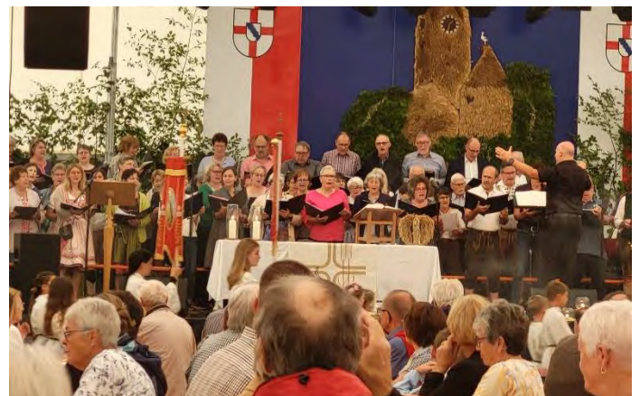
Festgottesdienst am Sonntag mit dem Kirchenchor Bohlingen