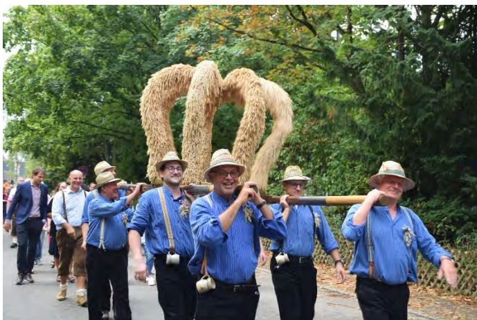
Umzug mit Erntekrone Richtung Festzelt

Und auch unser traditionelles Erntedankfest, die Bohlinger Sichelhenke, lockte Ende August wieder tausende Besucher nach Bohlingen. Trotz teilweise etwas kühlem und regnerischem Wetter wurde wieder ein umfangreiches Programm präsentiert. Viele Helfer und die Bohlinger Vereine trugen zum guten Gelingen bei. Mehr dazu im Innenteil dieser Ausgabe.