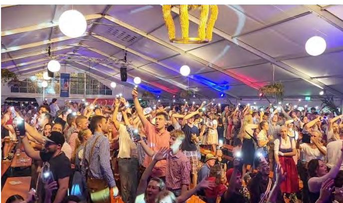
Stimmungsvoller Auftakt zum Bieranstich am Freitag mit der Münchner Zwietracht