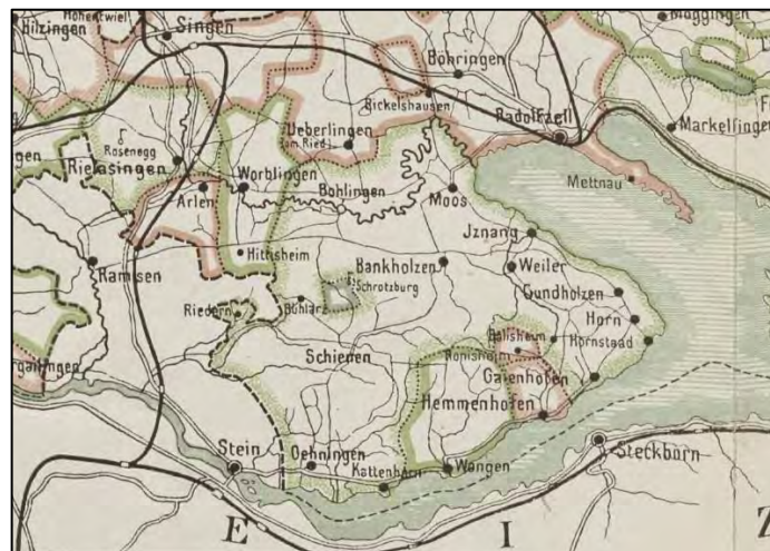
Orte des Amtes Bohlingen

17. Jahrhunderts das östlich angrenzende Obervogteiamt Gaienhofen angegliedert wurde.