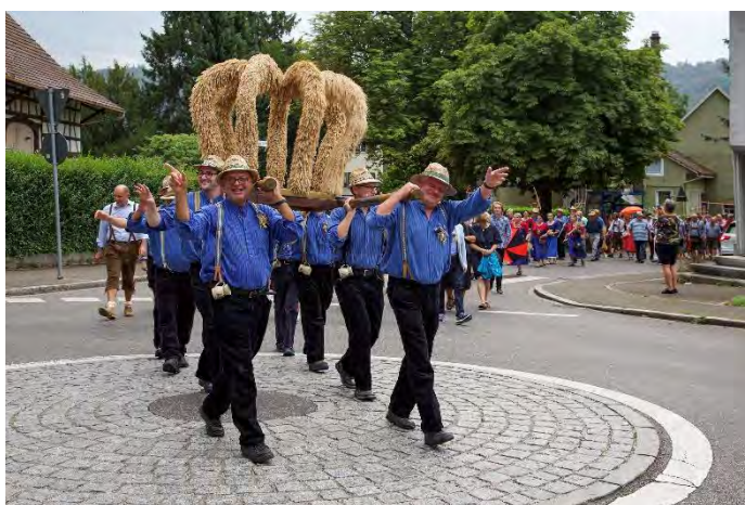
Träger der Erntekrone