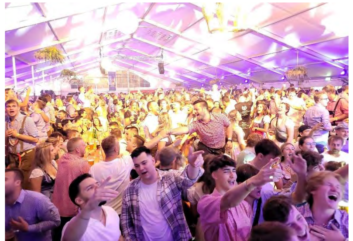
Ausgelassene Stimmung am Samstagabend im Festzelt mit dem Hofbräu Regiment