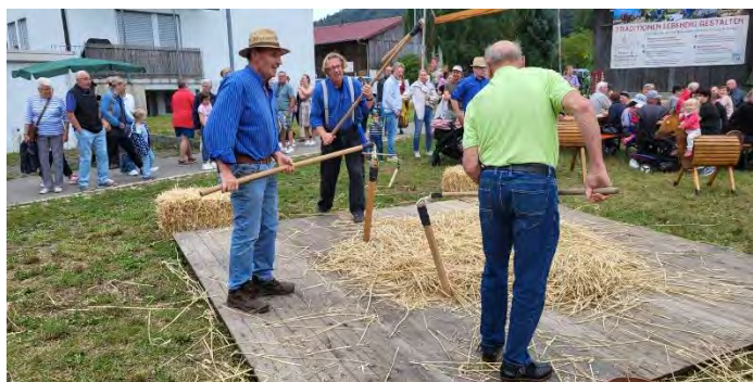
Der Heimat- u. Museumsverein beim Flegeln