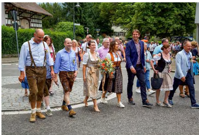
Umzug mit den Ehrengästen zum Festzelt