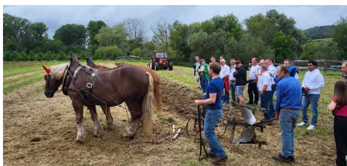
Pflügen mit den Kaltblütern