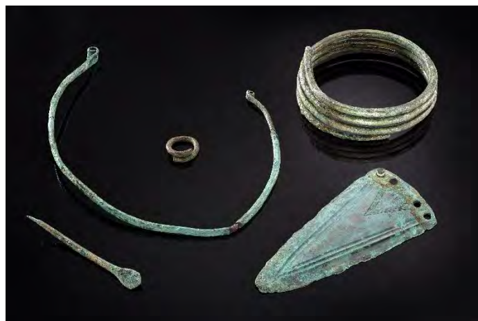
Bronzezeitliche Funde im Neubaugebiet „Auf der Höhe“

In den vergangenen Jahren wurden bei archäologischen Untersuchungen in Bohlingen und im Hegau neue Bestattungsplätze der Bronzezeit entdeckt.