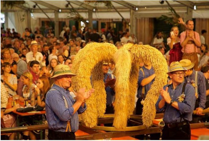
Erntekrone vor dem Aufzug ans Zeltdach