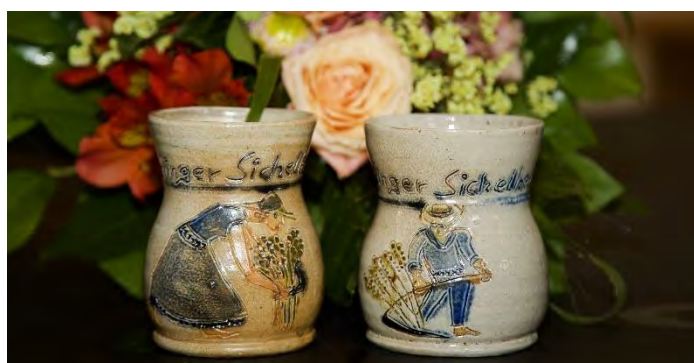
Mostkrüge für Schnitterinnen und Schnitter