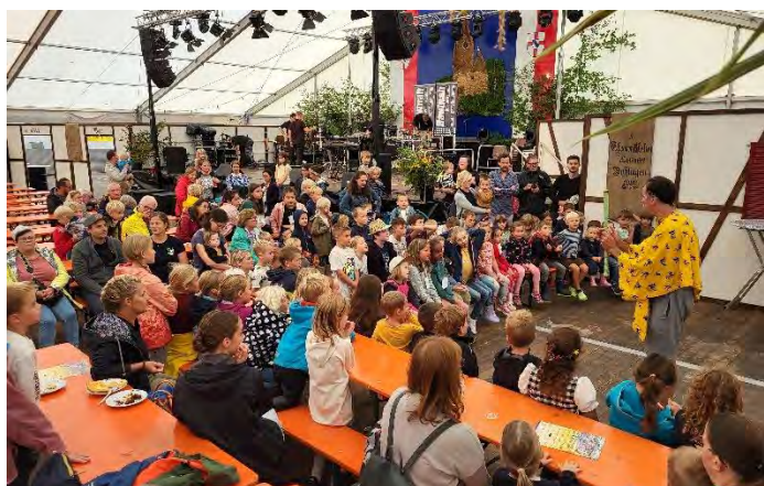
Kindernachmittag mit Zauberer am Sichelhenke-Montag