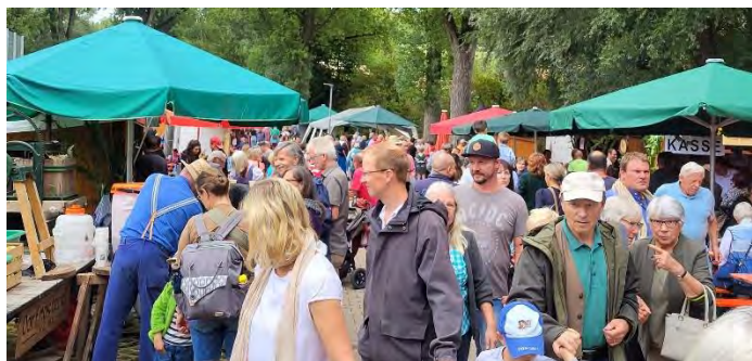
Besucherandrang auf der Marktgasse