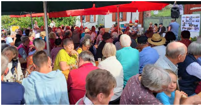
Bänklegespräch bei der Mosterei Müller

So fand in unserem Jubiläumsjahr 1250 Jahre Bohlingen Anfang August das zweite Bänklegespräch vor großer Kulisse bei der Mosterei Müller statt. Über 150 Zuhörer genossen die Geschichten von früheren Zeiten.