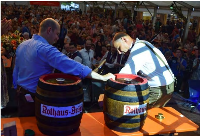
Oberbürgermeister Bernd Häusler beim Bieranstich