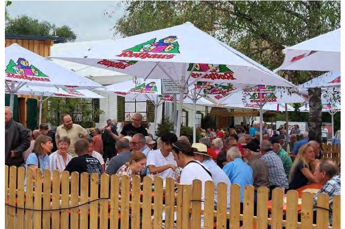
Biergarten vor dem Festzelt