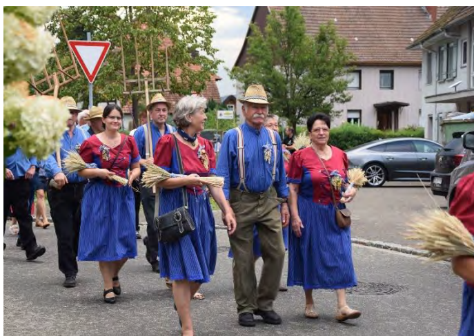
Schnitterinnen und Schnitter