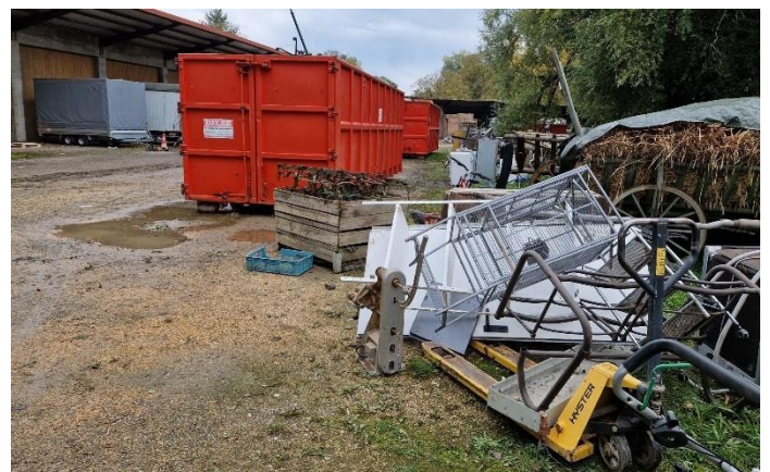
Schrottcontainer im Mattesareal

Es ist immer wieder faszinierend wieviel Schrott sich innerhalb eines Jahres in den Haushalten und bei den uns unterstützenden Firmen ansammelt. Die bestellten Absatzmulden haben bei weitem für den vielen Schrott nicht ausgereicht und so mussten am Montag noch einmal zwei Absatzmulden nachbestellt werden.