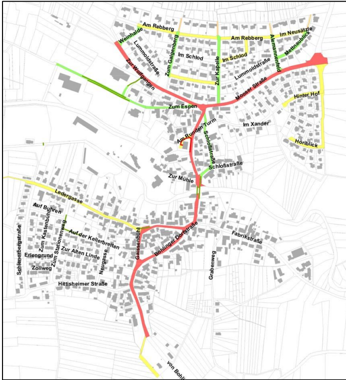
Schneeräumungskarte für Bohlingen

Nach dem Beschluss des Gemeinderats werden generell nur noch die Strecken der Prioritäten 1 und 2 abgefahren – die Priorität 3 wird nur noch bedient, wenn es personelle und zeitliche Ressourcen gibt.