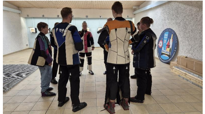
Atemtraining der Sportschützen