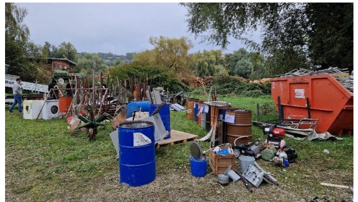
Schrott so weit das Auge reicht

der Förderverein SV Bohlingen e.V. möchte sich hiermit bei Ihnen allen für Ihre Schrottspenden bedanken. Bei der Schrottsammlung am 12. Oktober 2024 konnte durch Ihr zutun wieder ein beachtlicher Betrag für die Fußballjugend des SV Bohlingen gesammelt werden.