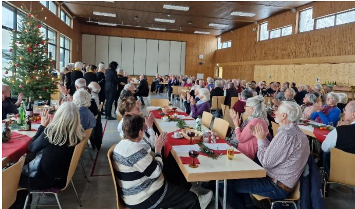
Bild vom Seniorennachmittag 2023

Hierzu laden wir alle Seniorinnen und Senioren ab dem 65ten Lebensjahr aus unserem Ortsteil Bohlingen ein. Neben Kaffee und Kuchen, Zopf und Getränken wartet wie in jedem Jahr auch noch ein Abendessen auf Sie.