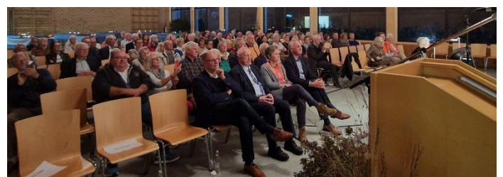
Andächtig lauscht das Publikum dem Gesang

Mit Reinhard Meys friedvollem Lied „Gute Nacht Freunde“ und den „Irischen Segenswünschen“ als Zugabe fand das Konzert einen würdigen Abschluss. Für die abwechslungsreiche Liederauswahl durch Sylvia Tröndle, die Darbietung des Chors, sowie die einführenden Ansagen Günter Schnells´ zu den Liedern bedankte sich das Publikum mit begeistertem Applaus.