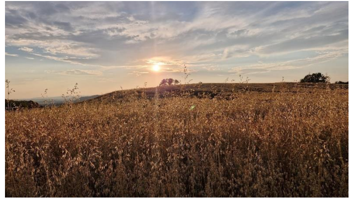
Feld mit Hafer auf dem Galgenberg Mitte Juli

Nehmen Sie sich für die Mahnung und den Ruf nach Frieden kurz diese 20 Minuten Zeit und zeigen Sie durch Ihr Kommen Anteil am Schicksal der vielen Toten in der heutigen Zeit!