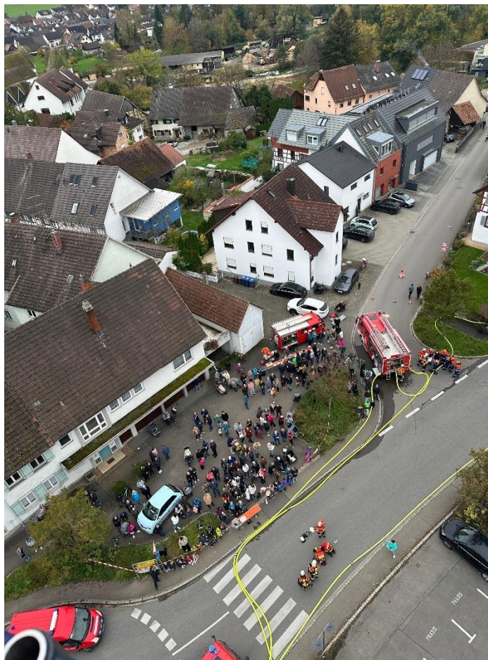
Von der Drehleiter fotografiert

Zur Unterstützung der Bohlinger Wehr waren auch die Kollegen von Überlingen am Ried und die Feuerwehr Rielasingen mit einer Drehleiter vor Ort.