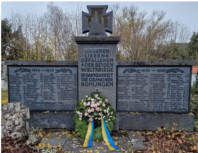
Kriegerdenkmal auf dem Bohlinger Friedhof

Im Namen des Ortschaftsrates Bohlingen darf ich Sie zur Gedenkfeier zum Volkstrauertag am Sonntag, 17. November 2024 um 10:00 Uhr auf den Bohlinger Friedhof vor dem Kriegerdenkmal einladen. Der Volkstrauertag wird ausgerichtet vom Ortschaftsrat mit musikalischer Begleitung des Musikvereins Bohlingen und der Freiwilligen Feuerwehr Bohlingen, welche den Kranz am Kriegerdenkmal niederlegt.