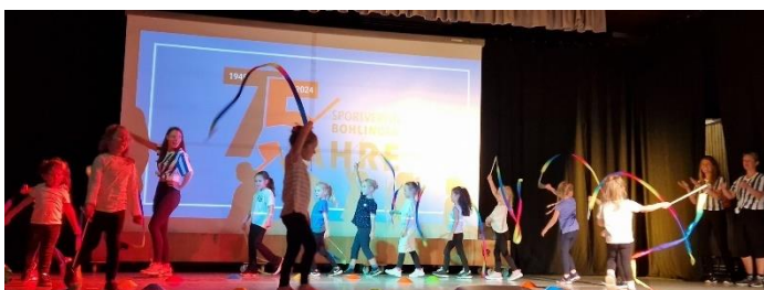
Tanzpiraten und Trübletänzer bei Ihrem Auftritt

Seiner Meinung nach ist es diese große Gemeinschaft und Hingabe, die den Sportverein zu dem macht, wie wir ihn kennen. Nur durch so viele Hände kann ein so umfangreiches Programm für Groß und Klein angeboten werden. Vielen Dank allen, die den SV Bohlingen in den letzten 75 Jahren so tatkräftig unterstützt haben!