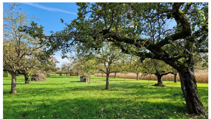
Abgeerntete Streuobstwiese am Heerenweg Ende Oktober

Bildmotive sagen manchmal mehr als tausend Worte! Genießen Sie unsere schöne Landschaft. Es gibt immer reizvolle Motive.