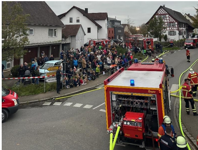
Viele Zuschauer verfolgten die Übung

Am Samstag, 26. Oktober 2024 fand die Jahreshauptprobe der Freiwilligen Feuerwehr Bohlingen am Übungsobjekt „Rehaktiv“ am Kreisel statt. Zu Übung waren wieder viele Familien mit Ihren Kindern gekommen und verfolgten gespannt den gezeigten Brandangriff.