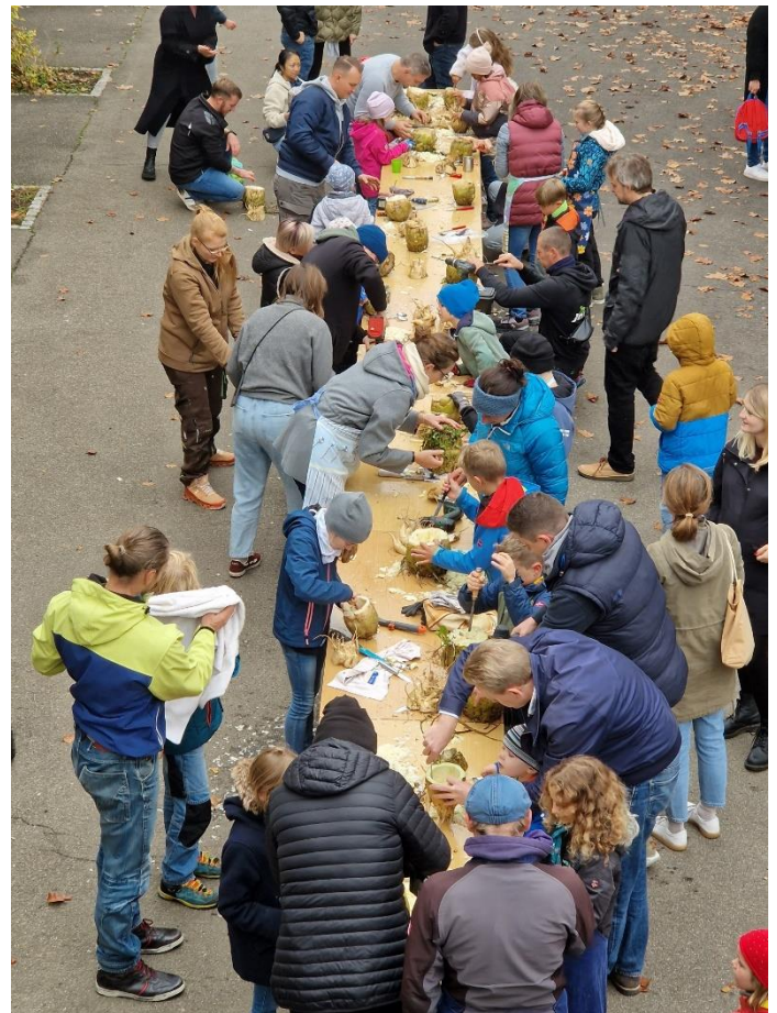
Kinder und Eltern beim „Rübengeist“ schnitzen

Unterstützt wurden sie dabei tatkräftig von vielen Mamas und Papas, die neben guten Ratschlägen hauptsächlich mit allerlei „Werkzeugen“ wie Bohrschraubern, Sägen, Löffeln, Schraubenziehern und Schnitzmessern kräftig zum Gelingen beigetragen haben.