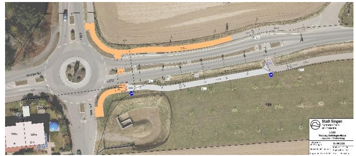
Radweg Richtung Moos

zum Kreisel unterbunden. Die Kosten für die Umsetzung trage der Kreis und mit Baubeginn wäre im Frühjahr zu rechnen.