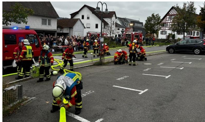
Schläuche werden verlegt

Eigentlich hätte auch eine zweite Drehleiter von Singen mit in die Übung einbezogen werden sollen. Diese musste jedoch kurzerhand zur Reparatur in die Werkstatt gebracht werden.