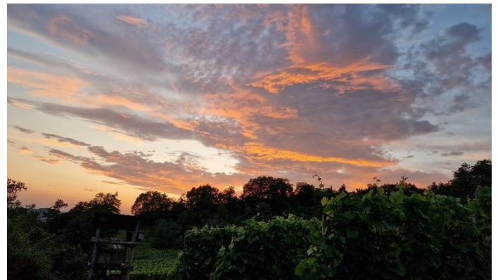
Weinberge mit Sonnenuntergang am Galgenberg Mitte Juli