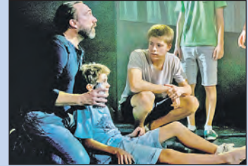
11. Februar: Kindertheater TKKG