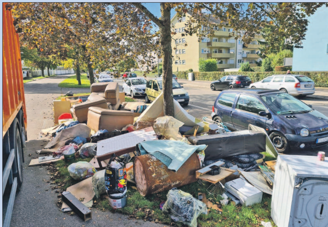
Wilde Müllablagerungen sind teuer: In diesem Fall in der Nordstadt waren es genau 496,40 Euro.

Für eine Bewohnerin aus der Nordstadt, die ihren Sperrmüll Anfang Oktober einfach auf die Straße gestellt hatte, statt einen Abfuhrtermin mit den Stadtwerken zu vereinbaren (einmal im Jahr ist dieser für jeden Singener Haushalt kostenlos), kam kürzlich das böse Erwachen, denn sie konnte als Verursacherin ermittelt werden. Und so erhielt sie eine Rechnung der Stadtwerke über 496,40 Euro. Zu den Entsorgungskosten für 1,4 Tonnen Sperrmüll in Höhe von 232,40 Euro kamen die Kosten für den Fahrer und Lader von jeweils zwei Stunden sowie für der Nutzung des Müllfahrzeugs in dieser Zeit.