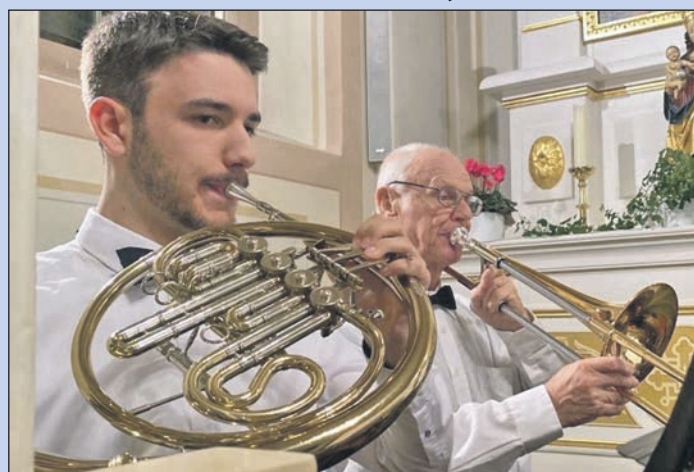
Ein Gewinnerfoto des Musikvereins Hausen a.d.Aach: Hier steht die Verbindung der Generationen durch die Musik im Mittelpunkt.

Auch für die Waldberghexen gab es 2020 viele schöne Momente. Den Hexen ist es wichtig, als Faschachtsverein „nicht nur zu feiern, sondern das Brauchtum Faschnacht“ an ihre Mitmenschen mit viel Freude weiterzugeben und näherzubringen. Daher sind sie seit zwei Jahren vor bzw. an der Faschnacht immer in Kindergärten und in der Kin-