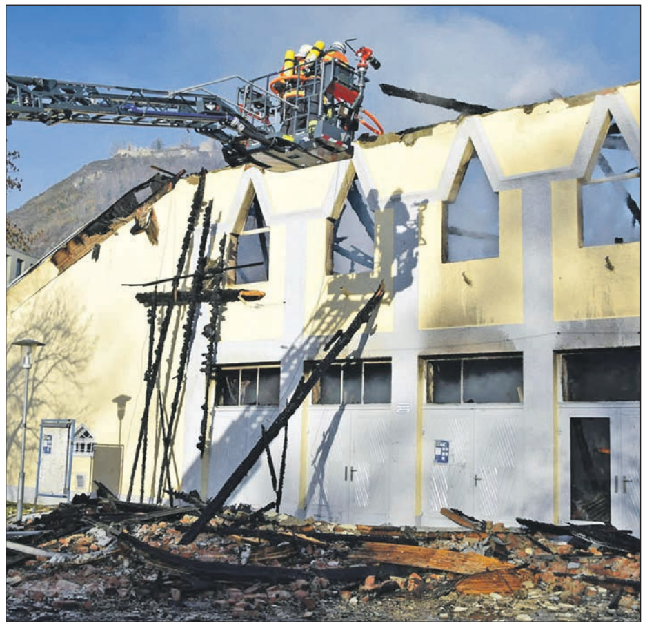
Die kriminalpolizeilichen und -technischen Untersuchungen zum Brand der Scheffelhalle haben ergeben, dass nach dem gegenwärtigen Stand der Ermittlungen von einer gewollten oder versehentlichen Inbrandsetzung als der wahrscheinlichsten Brandursache auszugehen ist.

Für Hinweise, die zur Aufklärung einer vorsätzlichen oder fahrlässigen Brandstiftung als Ursache des Scheffelhalle zerstörenden Brandes und zur Ergreifung des Täters führen, haben die Staatsanwaltschaft Konstanz und die Stadt Singen jeweils Belohnungen in Höhe von bis zu 3.000 Euro ausgesetzt. Hinweise bitte an die Ermittlungsgruppe „Insel“ unter Telefon 07731/888-333.