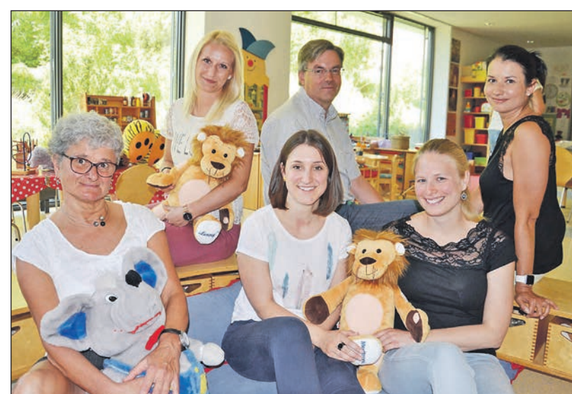
Gemeinsam arbeiten sie zum Wohle von Kindern, die an Diabetes erkrankt sind.

Ist ein Kind von dieser Autoimmunerkrankung betroffen, stellt dies das ganze Leben der Familie auf den Kopf. Die Eltern und mit zunehmenden Alter auch das betroffene Kind müssen lernen, mit der Erkrankung umzugehen. Damit der Alltag ge-