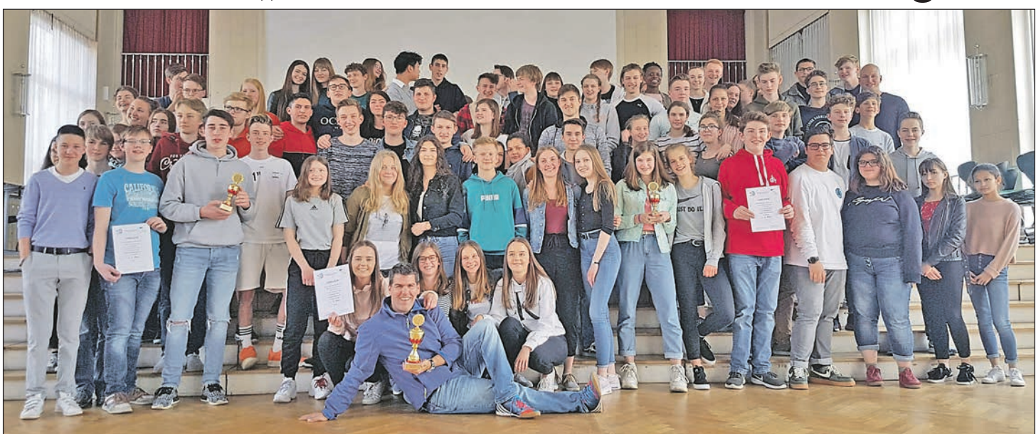
Das spannende Finale des internationalen Wettbewerbs „Mathematik ohne Grenzen“ fand am Hegau-Gymnasium statt. Beteiligt waren die Klassen 10b des Scheffel-Gymnasiums Bad Säckingen, die 9d des Heinrich-Suso-Gymnasiums Konstanz, die 10d des Stöckacher Neulenburg-Gymnasiums, die 10a des Friedrich-Hecker-Gymnasiums Radolfzell und vom Hegau-Gymnasium die 9a. Sieger wurde das Scheffel-Gymnasium. Aber letztlich haben alle gewonnen, denn die Stadt Singen schenkte sämtlichen Teilnehmern Freikarten fürs Aachbad.