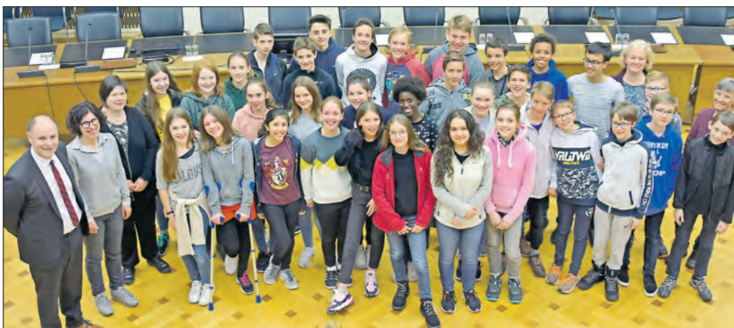
Das Friedrich-Wöhler-Gymnasium führt in diesem Schuljahr zum ersten Mal einen Austausch mit der Cité Scolaire Internationale in Grenoble (Frankreich) durch. 33 Schülerinnen und Schüler aus den 8. Klassen waren im März in Grenoble zu Gast. Sie hatten dort Unterkünfte bei Gastfamilien, lernten die Schule ihrer Austauschpartner kennen, nahmen auch am Unterricht teil und machten viele Ausflüge und Besichtigungen.