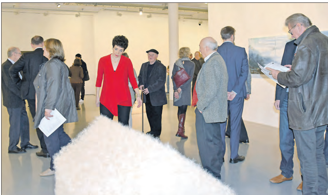
Auf sehr große Resonanz stieß die Eröffnung der Ausstellung des Kunstvereins Singen. Unter dem Titel „SingenKunst2019 Stadt Berg Fluss“ sind die originellen Werke von 21 Künstlerinnen und Künstlern aus Deutschland, der Schweiz und Österreich noch bis zum 23. Juni 2019 im Kunstmuseum zu sehen. Diverse Kunststile mit unterschiedlichsten Medien wie Video, Fotografie, Installation sowie Objekt- und Konzeptkunst laden zur Auseinandersetzung mit der Kunst ein. Eine Führung durch die Ausstellung mit der Präsentation der begleitenden Publikation findet am Sonntag, 28. April, um 11 Uhr statt.