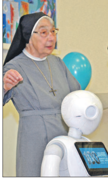
Schwester Liliane Juchli, die Pionierin der deutschsprachigen Pflegeausbildung, ist verstorben. Unser Archivbild zeigt sie beim Festakt zu 100 Jahre Krankenpflegeschule Singen.

testen und renommiertesten Persönlichkeiten der Profession Pflege war, eine unglaubliche Präsenz aus.