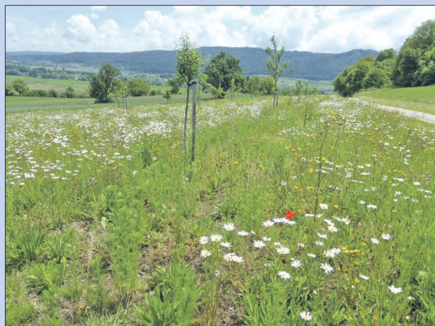
Im Singener Ortsteil Bohlingen wurden bereits im vergangenen Jahr dreißig Hochstammobstbäume auf 3.400 Quadratmeter Wiese gepflanzt.

Weiterhin ist angedacht, eine Pasteurisier-Anlage sowie landwirtschaftliche Geräte zur Heugewinnung mit kleinen Schleppern anzuschaffen. Sowohl der Kindergarten als auch junge Familien sollen beispielsweise durch Übernahme von Baupatenschaften miteinbezogen werden. Übrigens ist auch die Bohlinger Dorfmoterei am Projekt beteiligt.