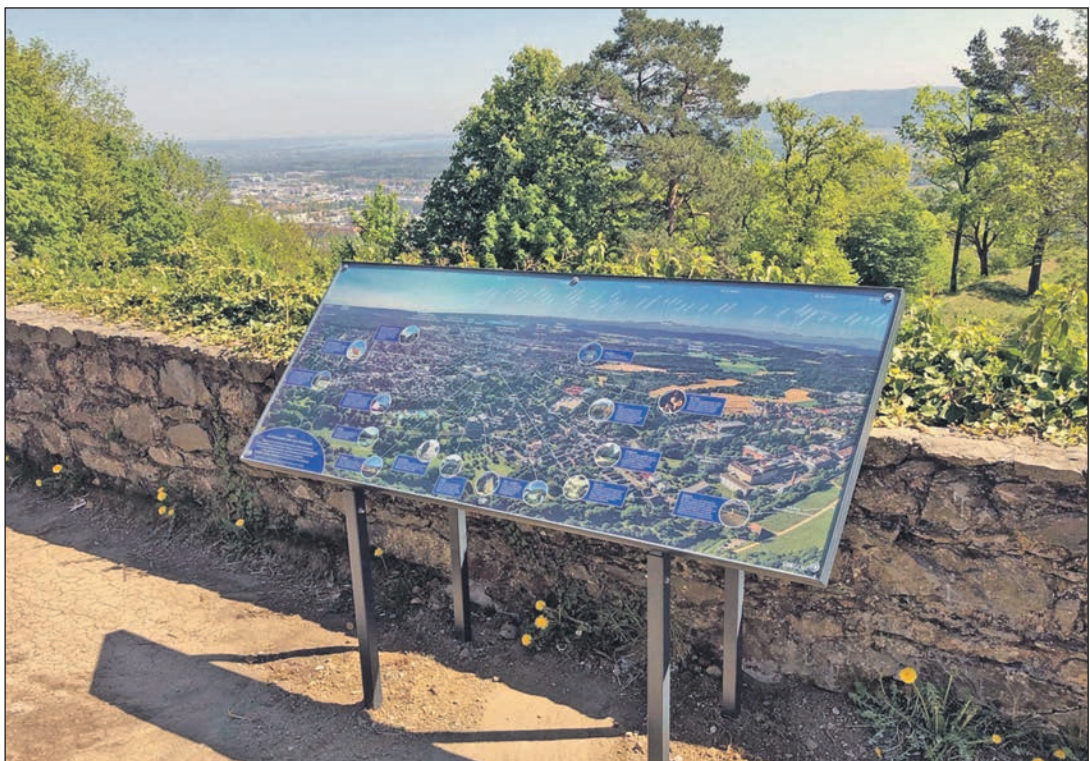
Mit Unterstützung der Freunde des Hohentwiels hat die Stadt Singen ein neues Panoramaschild auf der Karlsbastion angebracht. Es soll den Besucherinnen und Besuchern die Stadt mit ihren Sehenswürdigkeiten näherbringen. Bei Nicht-Singenern möchte man auf diese Weise das Interesse an den örtlichen Besonderheiten wecken und zu einem Stadtbummel anregen. – Und für Einheimische ist es sicherlich spannend, Singen aus einer anderen Perspektive zu entdecken.