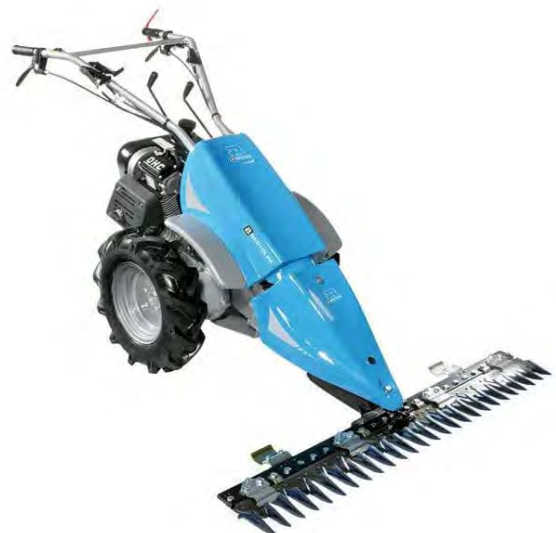
Meseralkenmäher gefördert durch ILE-Kleinprojektförderung 2020