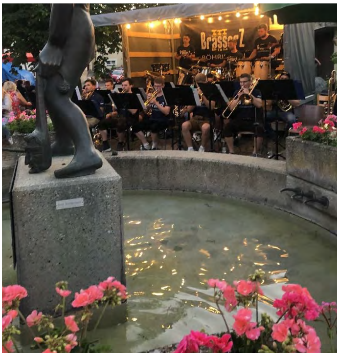
Blaskapelle „Brasserz“ am Brunnenfest

Ein besseres Wetter hätten wir uns für das Brunnenfest nicht aussuchen können. Die sommerlichen Temperaturen lockten zahlreiche Besucher an das gemütliche Fest rund um unseren schönen Narrenbrunnen. Die jungen Musiker der Blaskapelle „Brasserz“ aus Böhringen sorgten mit ihrem bunten Programm von Polka, über Schlager bis hin zu Brass für die perfekte musikalische Unterhaltung.