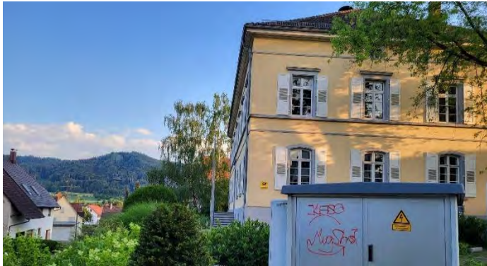
Stromkasten am Rathaus

In der Nacht von Freitag, 03.06.2022 auf Samstag, 04.06.2022 wurde an mehreren Stellen im Oberdorf einige Sachbeschädigungen durch Graffiti verursacht. Unter anderen wurde der Stromkasten der Thüga am Rathaus, das Buswartehäuschen der Stadtwerke, sowie Straßenschilder der Stadt Singen beschmiert. Hierbei handelt es sich um eine Straftat, die von den betroffenen Behörden zur Anzeige gebracht wird.