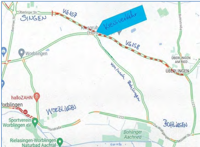
Kartenausschnitt Straßensperrung Überlingen a.R. – Singen