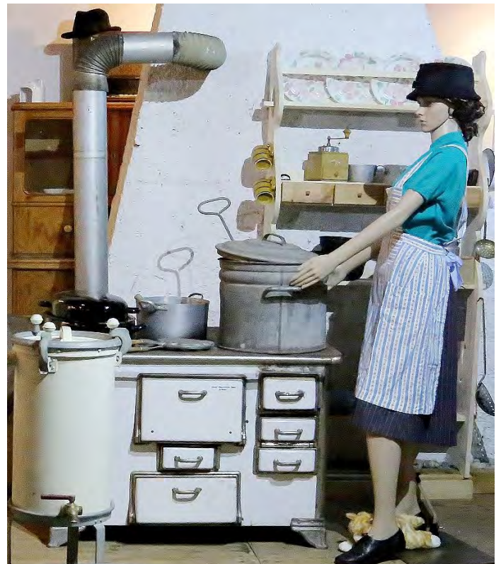
„Frau am Holzherd“ zu sehen im Rathausspeicher