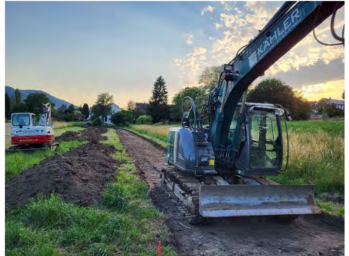
Blick vom Hörblick Richtung Schlossstraße

Mit dem Bau des Verbindungsweges von der Schlossstraße zum Baugebiet Hörblick wurde Mitte Juni 2022 begonnen. Die Bagger haben die entsprechende Fläche bereits entsiegelt. In den kommenden Tagen wird die Kiestragschicht aufgetragen. Später im Herbst wird eine noch zu pflanzende Baumallee den neuen Fuß- und Radweg säumen.