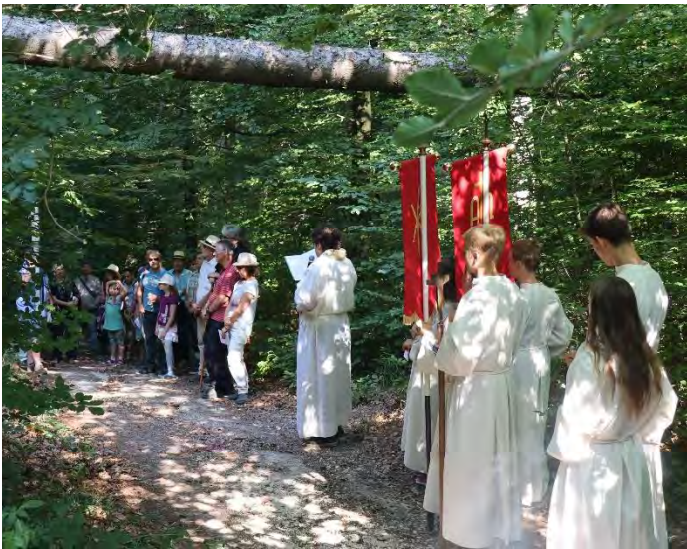
Unterwegs auf dem Stationenweg

Nach 2 Jahren Zwangspause dürfen wir uns am Sonntag, 3. Juli 2022 endlich wieder auf den Weg zur Wallfahrt nach Schienen machen.