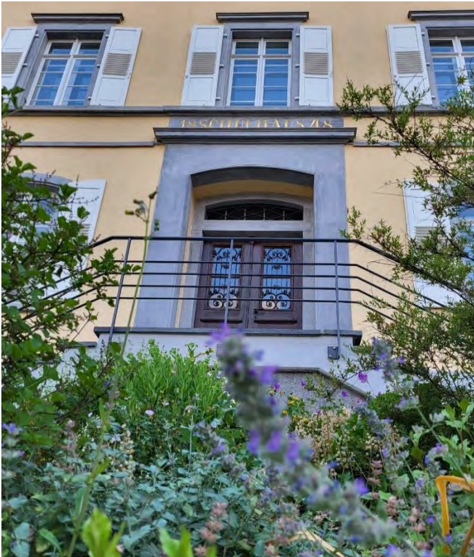
Historischer Eingang Rathaus Bohlingen