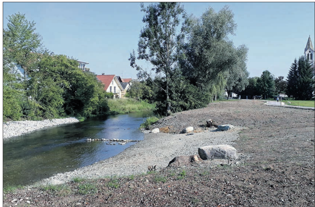
Mit der Uferrenaturierung in Beuren soll die Flusslandschaft an der Hegauer Aach für Menschen, Tiere und Pflanzen noch lebenswerter gemacht werden.

Das Kulturprogramm der Stadthalle startet am 3. Oktober mit der Südwestdeutschen Philharmonie Konstanz. „Wegen der zahlreichen Abonnenten unserer Symphonierei-