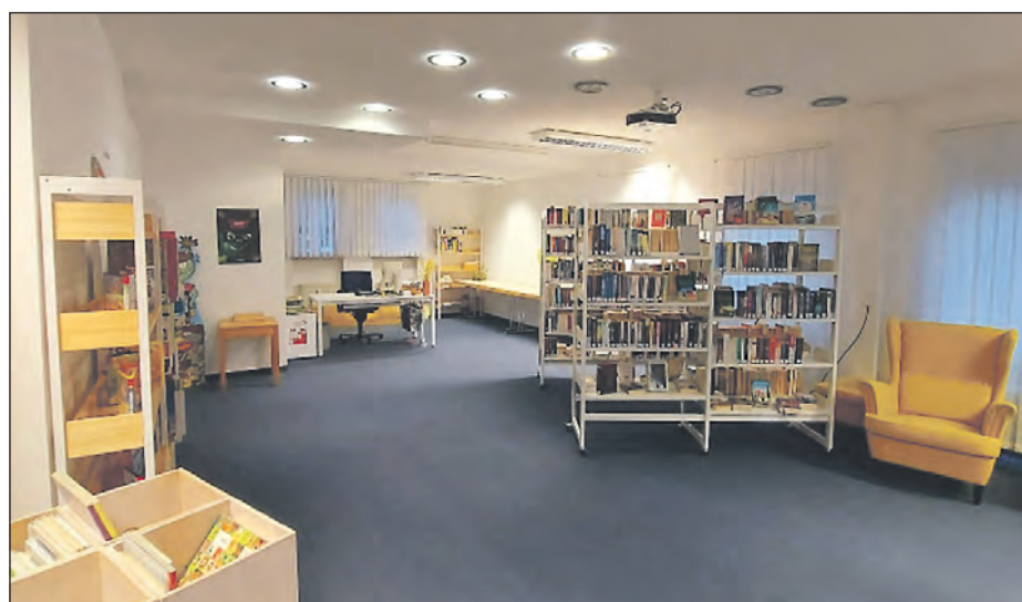
Das „Fitness-Café“ in den Räumen der Stadtbücherei Friedingen findet immer montags von 14.30 bis ca. 16.30 Uhr statt.