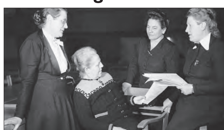
Die „Mütter des Grundgesetzes“: Elisabeth Selbert, Helene Weber, Frieda Nadig und Helene Wessel.

Eine Poster-Ausstellung unter dem Titel „Mütter des Grundgesetzes“ präsentiert die vhs in Zusammenarbeit mit dem Helene-Weber-Kolleg und dem Bundesministerium für Familie, Senioren, Frauen und Jugend anlässlich des 75-jährigen Jubiläums des deutschen Grundgesetzes vom 8. April bis zum 31. Mai 2024 in der vhs Singen (Theodor-Hanloser-Straße 19).