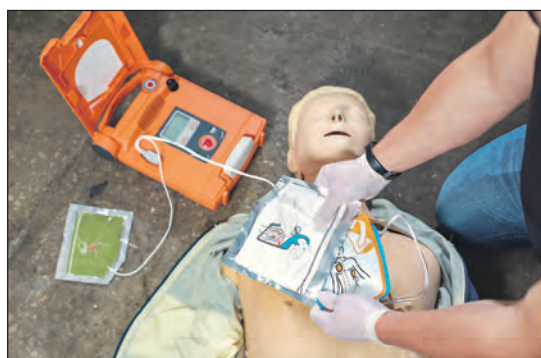
Kostenlos und ohne Anmeldung: die Reanimationsschulung am 11. April im Singener Rathaus.

Weitere Informationen unter www.steiger-stiftung.de