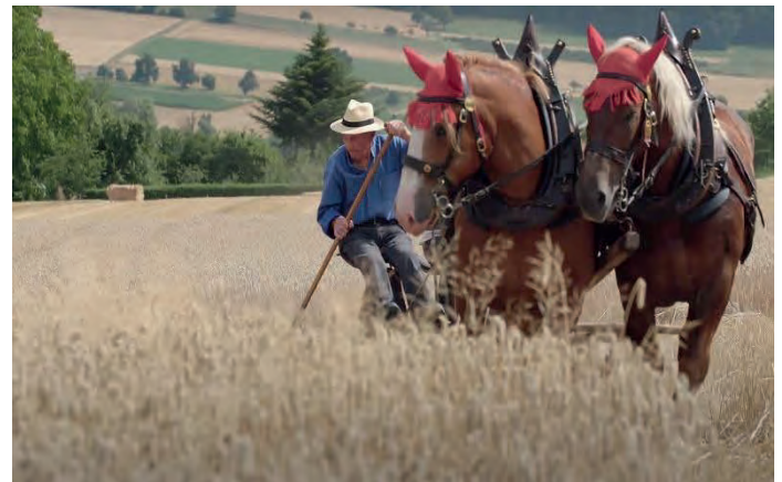
Weizenernete mit Pferden – Bild HMV

Das Einholen des erntereifen Hafers ab ca. 16:00 Uhr übernehmen unsere routinierten Schnitter und Schnitterinnen mit Haberg'schirr und Sichel, die bei ihrer schweißtreibenden Tätigkeit von zwei Pferden unterstützt werden, welche eine historische Mähmaschine ziehen.