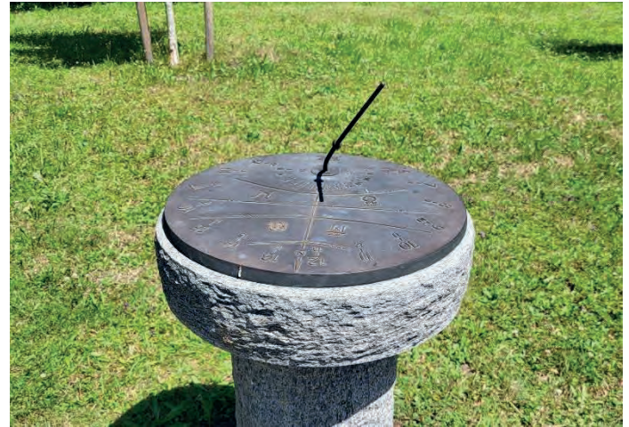
Sonnenuhr auf dem Friedhof