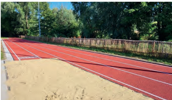
Neue Tartanbahn am Schulsportplatz

Am Schulsportplatz wurden die vergangenen Wochen die Tartanbahn, die Einfassungen sowie die Weitsprunggrube komplett erneuert. Für die gesamte Maßnahme wurden insgesamt ca. 90.000 Euro aufgewendet.