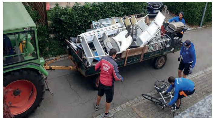
Fußballer sammeln Schrott für die Fußballjugend – Bild 2021

Der Förderverein des Sportverein Bohlingen e.V. führt am 24. September 2022 die jährliche Schrottsammlung durch. Der Erlös aus dem Metallschrott kommt der Fußballjugend zu Gute. Wenn auch Sie Metallschrott haben, dürfen Sie diesen gerne an diesem Tag ab 8:00 Uhr an den Straßenrand stellen.