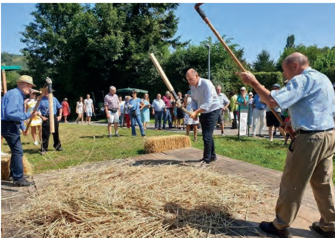
Flegelbühne mit Oberbürgermeister Bernd Häusler 2019