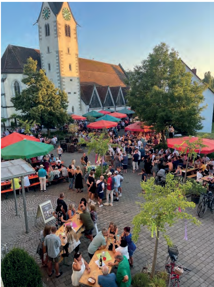
Bohlinger Weinfest 2022

Kein Wunder, dass die Besucherscharen den festlich dekorierten Platz zwischen Kirche, Gemeindehaus und Rathaus schon früh füllten und erst spät wieder nach Hause gingen. Zur Freude der Besucher – und zum Ärger der Pizzadienste – konnten wir das breit gefächerte Angebot an Speisen und Bohlinger Rebholz Weinen dieses Jahr noch bis zum Schluss anbieten.