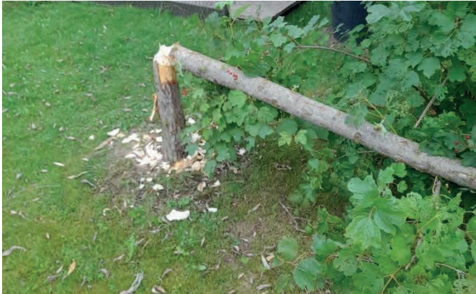
Frassschäden durch Biber

Wasserpflanzen und Laubbäume, wie Espen, Erlen und Pappeln. Er verzehrt Zweige, Astrinde und Blätter der von ihm gefällten Bäume. Der Biber ist dämmerungs- und nachtaktiv. Beim Abholzen benagt er den Stamm rundum in der sogenannten Sanduhrtechnik. Je nach Härte des Holzes kann ein Biber in einer Nacht einen bis zu 50 Zentimeter dicken Baum fällen.