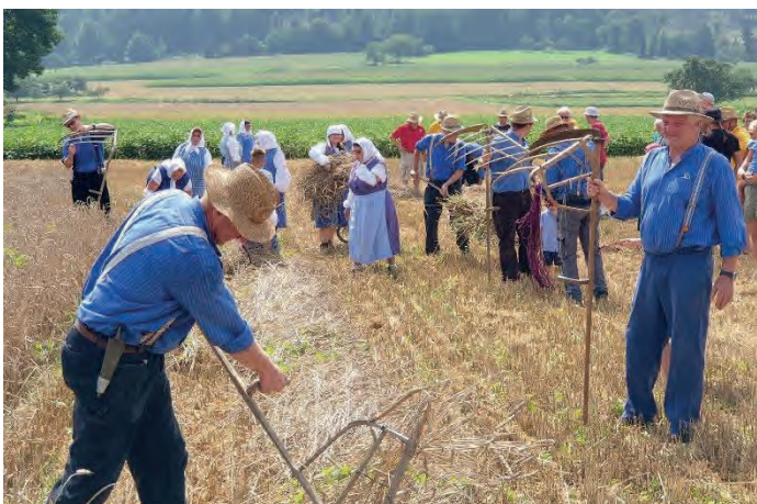
Traditionelles Mähen 2021

Wir freuen uns auf viele Besucher der Marktgasse am Sonntag, 7. August 2022 und über alle historisch Interessierten, welche sich das Mähen am Samstag, 6. August 2022 anschauen möchten.