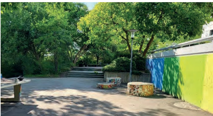
Geplanter Standort unterer Schulhof

Ein Standort auf dem unteren Schulhof wurde in einem Vorort-Gespräch mit den Kindern und Jugendlichen, den Eltern, dem Förderverein GHS, der Schule, dem Ortschaftsrat und den Nachbarn begutachtet und für umsetzbar empfunden. Daraufhin hat die Gemeinde Bohlingen bei der Kleinprojektförderung ILE einen Förderantrag über 20.000 Euro gestellt. Einige Wochen später kam die Zusage zur Förderung. Es schien, als ob nun der Wunsch der Kinder in Erfüllung gehen sollte.