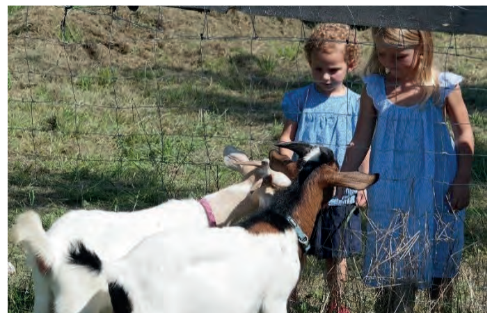
Kinder beim Ziegen füttern Sichelhenke 2019

Kinder aufgepasst: Tolle Mitmach-Aktionen für Euch am Sonntag. Möchtest Du auch mal ein Schaf füttern oder einen Esel streicheln? Ja, dann komm zu unserem Streichzoo, wo viele weitere Bauernhoftiere auf Dich warten.