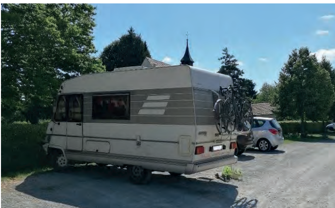
Wildes Campieren am Friedhofsparkplatz

Laut dem Ordnungsamt der Stadt Singen ist das Campieren und Abstellen an dieser Stelle nicht gestattet. Es wurde in diesen Fällen ein Verwarnungsgeld ausgesprochen. Der Parkplatz dient lediglich für die Friedhofsbesucher und Gäste des Hotel Zapa.