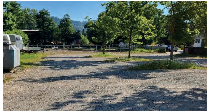
Ersatzstandort Parkfläche bei Glascontainer

Fieberhaft wurde nach einem Ersatzstandort gesucht und mit der Parkfläche neben dem Glascontainer gefunden. Die Stadt Singen wäre hier bereit gewesen eine Teilfläche zu asphaltieren, um dort die kleinen Skaterelement aufstellen zu können.