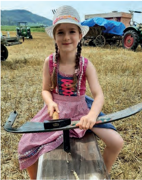
Dengeln einer Sense

Genau wie Deine Urgroßeltern es früher taten. Und Eure ganz kleinen Geschwister können von einem unserer Holzpferde dem bunten Markttreiben zuschauen.