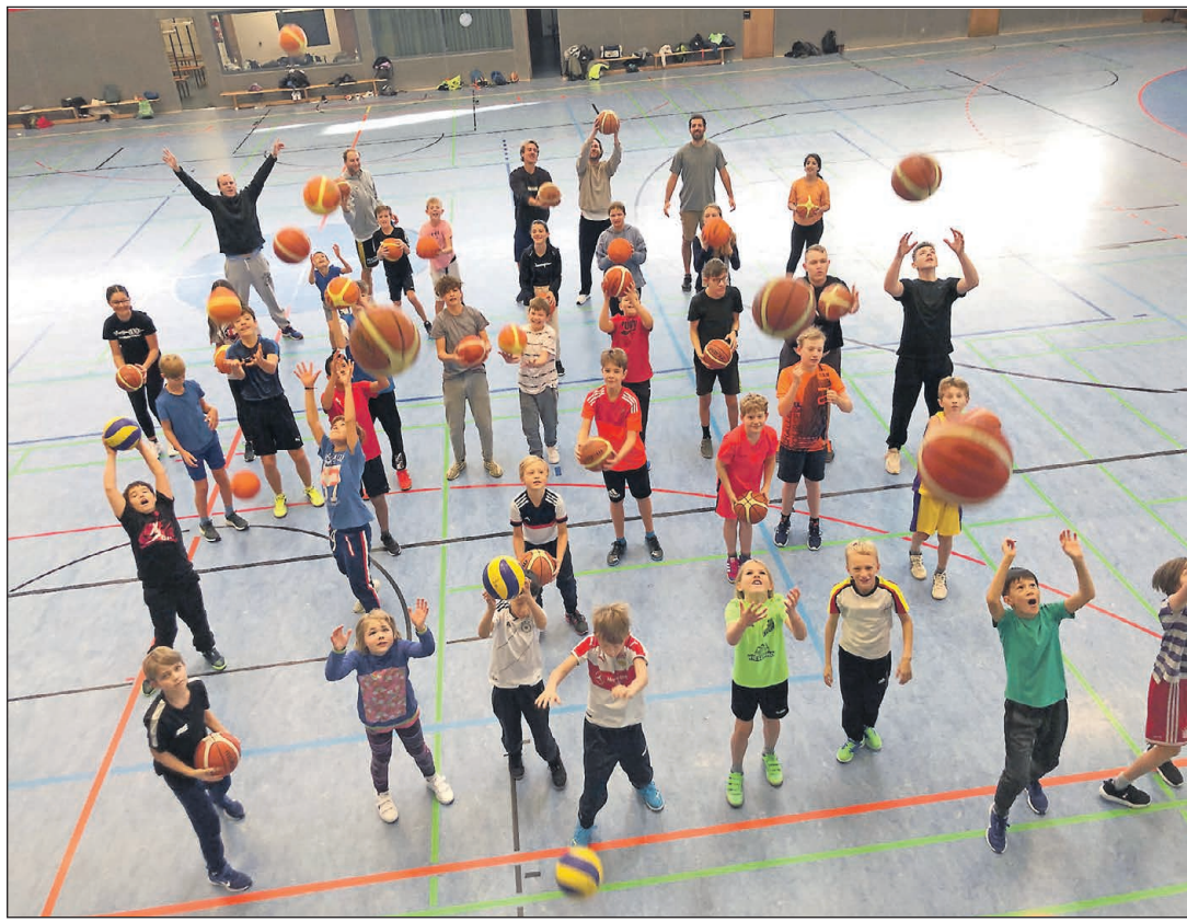
Die Kinder und Jugendlichen hatten sichtlich viel Spaß beim Basketballcamp der Singener Kriminalprävention.