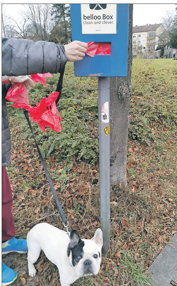
Das Frauchen dieses Vierbeiners macht es richtig: Die Hundebesitzerin holt sich die kostenlosen Beutel aus der BellooBox, um die Hinterlassenschaft ihres Lieblings ordnungsgemäß zu entsorgen.

Also hier nochmals der Appell an diejenigen Hundehalter, die denken „ich lass‘ das jetzt einfach mal liegen – merkt ja keiner“: „Doch, das riecht man und es sieht einfach nur ekelhaft aus! Wer einen Hund hält, dann bitte auch verantwortungsvoll und so, dass die Mitmenschen nicht belästigt werden. Seien Sie sozial und entsorgen Sie die Hundehaufen, die Ihr Liebling produziert hat.“