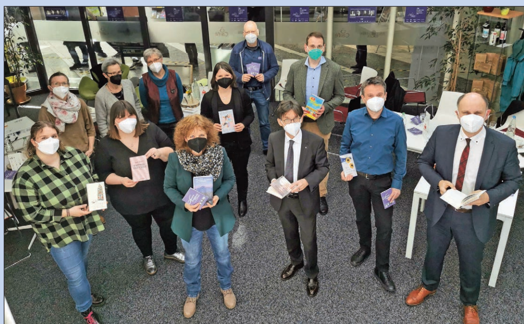
Organisatoren, Sponsoren und Gastgeber von Lesungen freuen sich, dass das Literaturfestival „Erzählzeit ohne Grenzen“ – nach einem Jahr Pause – wieder stattfinden kann.