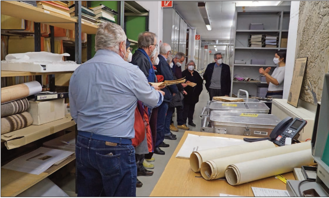
Kurzweilige Magazinführung am Tag der Archive im Stadtarchiv Singen.