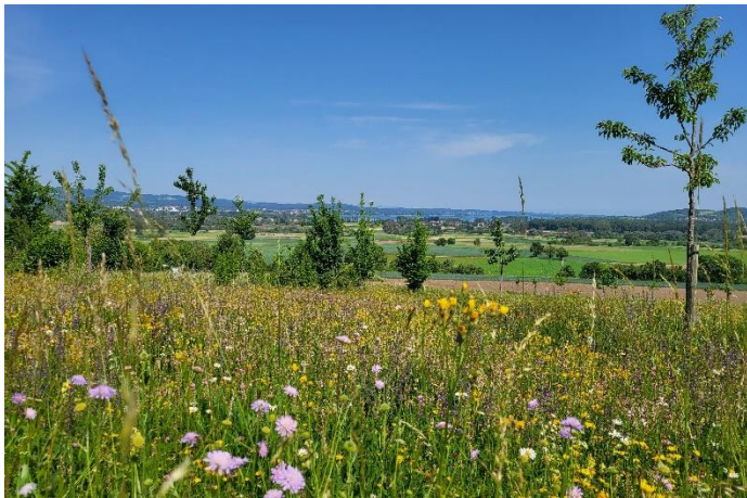
Blick vom Galgenberg auf den Bodensee

Auch die kommende Informationsveranstaltung zur Nachbarschaftshilfe dürfte nicht nur für die ältere Bevölkerung, sondern auch für die Jüngeren von Interesse sein. Mit Ihrer Unterstützung könnten wir auch dieses Konzept in Bohlingen etablieren. Der Ortschafts- rat Bohlingen unterstützt dieses Konzept und darf Sie alle schon heute herzlich hierzu einladen.