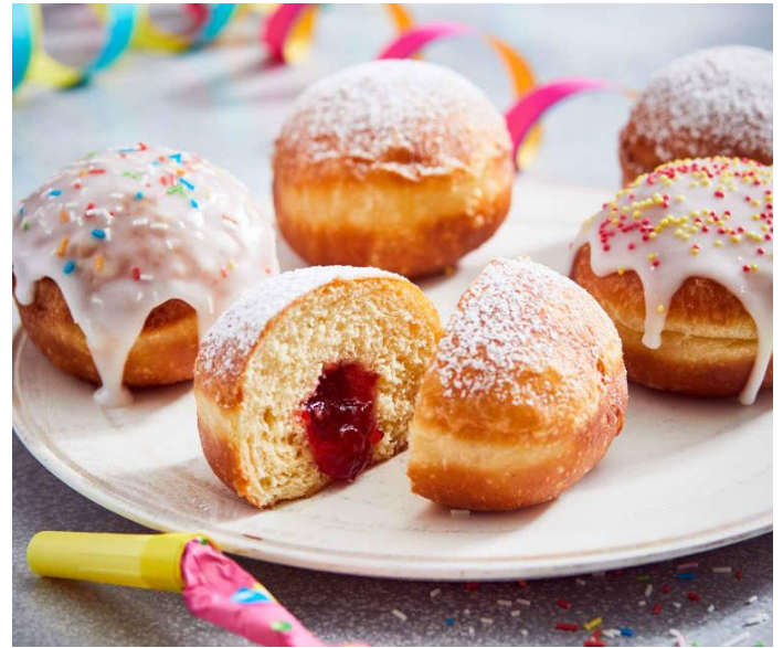
Berliner gratis in der Bücherei

Am Rosenmontag, 20. Februar 2023 hat die Bücherei im Rathaus zu den gewohnten Zeiten von 16:00 bis 18.30 Uhr geöffnet. Alle Besucher erhalten an diesem Tag einen „ Berliner “ gratis spendiert. (nur solange Vorrat reicht)