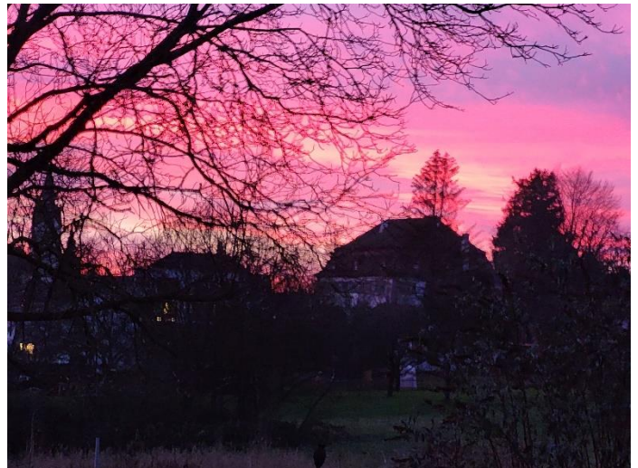
Blick auf Schloss und Kirchturm, aufgenommen am 31.12.2022