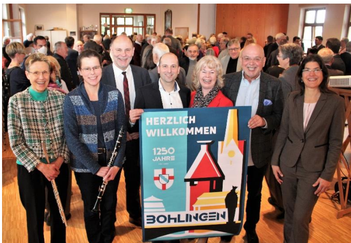
Gruppenbild von allen Beteiligten