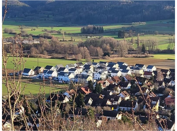
Baugebiet Hinter Hof 3 „Auf der Höhe“

So konnte das neue Baugebiet Hinter Hof 3 mit dem Straßennamen „Auf der Höhe“ – dieser rührt übrigens von dem angrenzenden Flurnamen her – zügig bebaut werden. Insgesamt wurden 32 Einfamilienhäuser und 4 Doppelhäuser gebaut. Die Vergabe der 4 Mehrfamilienhäuser ist zwar bereits im vergangenen Jahr nach einem Wettbewerb abgeschlossen worden. Die vier Gewinner könnten theoretisch jederzeit mit dem Bau beginnen, doch die aktuelle Zinssituation und die gestiegenen Baukosten lassen die Beteiligten aktuell doch zögern. Leider hat das vorgegebene Auswahlverfahren zudem viel Zeit und einen früheren Baubeginn der Interessenten zu besseren Konditionen verhindert.