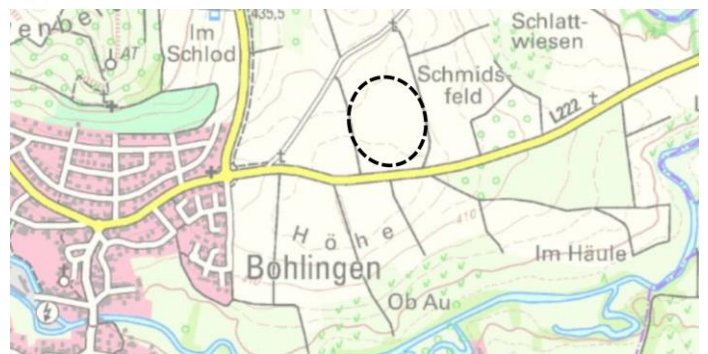
Standort geplanter Solarpark Bohlingen

Frau Martin von der Abteilung Stadtplanung stellte in der Ortschaftsratsitzung die geplante Fläche für die Ausweisung eines Solarparks vor. Mit der Errichtung einer Freiflächen-Photovoltaikanlage soll ein Beitrag zur Energiewende und somit zum Ausbau der erneuerbaren Energien geleistet werden. Die planungsrechtlichen Voraussetzungen für die Errichtung dieser Freiflächen-Photovoltaikanlage sollen mit der Flächennutzungsplanänderung geschaffen werden. Für das Bebauungsplanverfahren ist am 21. September 2022 im Ausschuss für Stadtplanung und Bauen der Stadt Singen der Aufstellungsbeschluss gefasst worden.