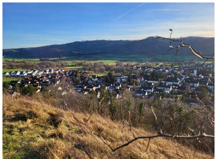
Blick auf Bohlingen vom Galgenberg, aufgenommen am 01.01.2023