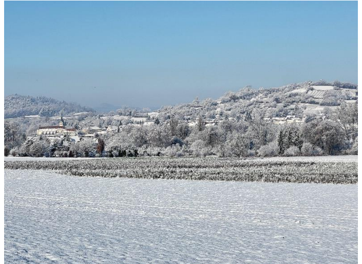
Blick auf Bohlingen im Schnee, aufgenommen am 11.12.2022