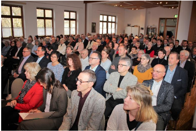
Gäste beim Neujahrsempfang, Bild: Rolf Hirt

Dabei ist unser Ziel, die vorhandenen Infrastrukturen zu erhalten, die Zukunft mitzugestalten, weiterhin Ansprechpartner für Sie alle im Dorf zu sein und natürlich die Interessen der Bohlinger und unseres Dorfes gegenüber der Stadt Singen würdig vertreten.