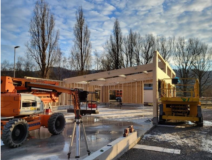
Festzeltanbau auf dem Festplatz

Hegau bekannten und eines der größten Heimatfeste in der Region – die Bohlinger Sichelhenke.