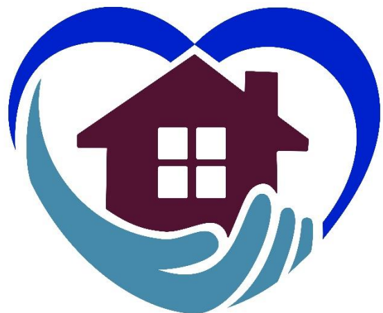
Logo Bürgerverein Überlingen a.R.

Ein wichtiges Thema für den Ortschaftsrat ist die Alten- oder Nachbarschaftshilfe für die ältere Bevölkerung. Bohlingen ist im Jahr 2022 in die Nachbarschaftshilfe Überlingen a.R. beigetreten. Dazu fand im Mai 2022 eine Informationsveranstaltung für die Bevölkerung statt. Wenn Sie oder Ihre Senioren Bedarf haben für Hilfe im Alltag, bei Arztbesuchen oder einfach nur, um Kontakte zu pflegen, sei es in Gesprächen oder bei Spaziergängen, kann die Nachbarschaftshilfe hier gerne unterstützen. Freiwillige ehrenamtliche Helfer stehen hier in Bohlingen und Überlingen bereit und werden natürlich auch noch gesucht. Gerne dürfen sich jüngere Mitbewohner aber auch rüstige Seniorinnen und Senioren, die sich aktiv in die Nachbarschaftshilfe einbringen möchten, bei uns melden. Die Koordination der Termine erfolgt über den Bürgerverein Überlingen am Ried. Bei Interesse dürfen Sie sich gerne auch an die Verwaltungsstelle in Bohlingen wenden.