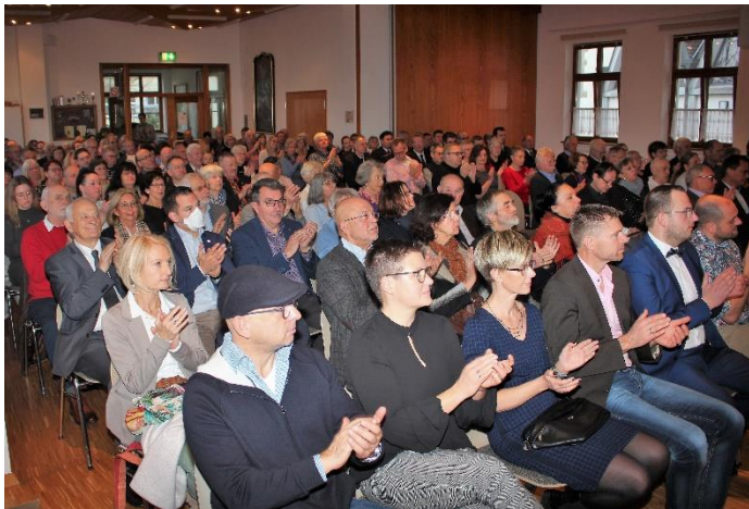
Gäste beim Neujahrsempfang

Mit dem Bohlinger Blättle haben wir im Jahr 2022 ein neues Medium für Sie alle geschaffen, bei der wir monatlich über Themen aus der Verwaltung, dem Rathaus, rund um Bohlingen berichten und auch den Vereinen eine Plattform geben, über ihr Vereinsleben und ihre Veranstaltungen zu berichten. Wir hoffen, dass dies gut bei Ihnen angekommen ist?