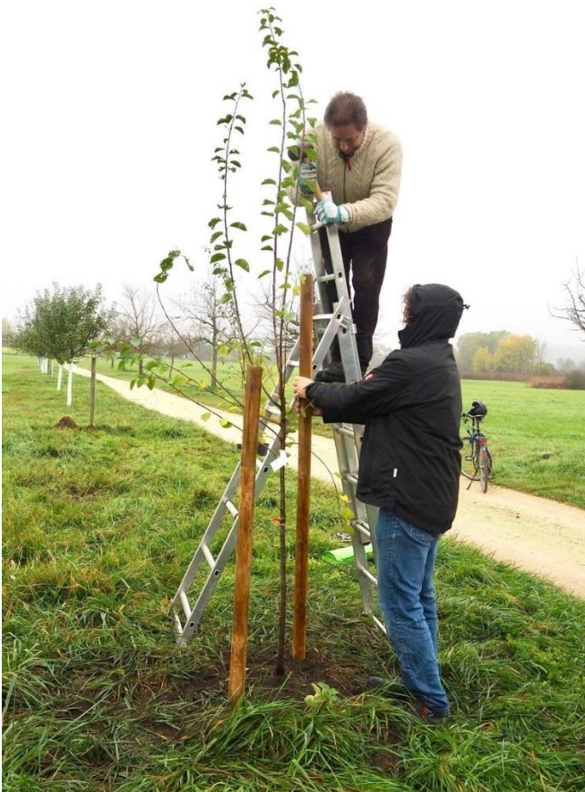
Fachgerechtes Nachpflanzen einer Mirabelle

Es geht immer um die richtige Balance: Jungbäume pflanzen ist wichtig, Altbäume erhalten aber auch!