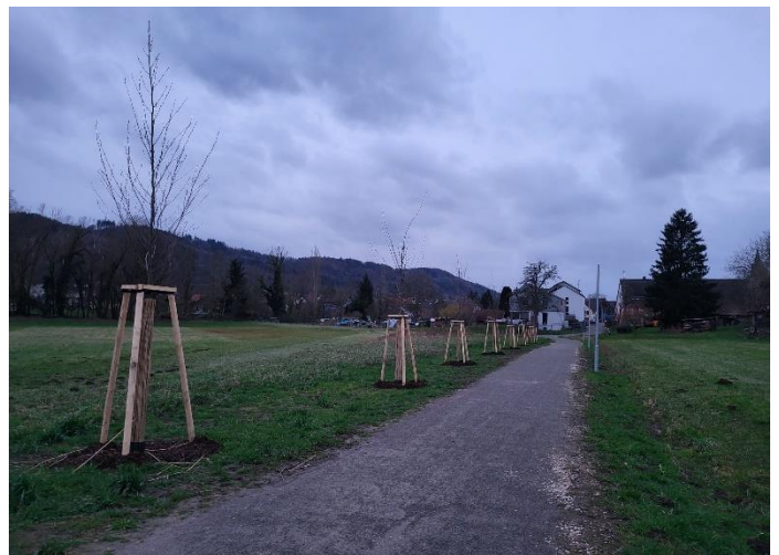
Neuer Verbindungsweg Schlossstraße - Hörblick

Der Weg wird aktuell sehr gut angenommen und war absolut die richtige Entscheidung, diesen anzulegen. Vergangene Woche sind hier noch Bäume gesetzt worden. Im Frühling wollen wir hier noch eine Sitzbank anbringen.