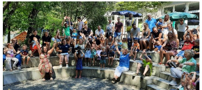
Einweihung neue Außenanlage am Kindergarten

Der enorme Zuzug von Kindern im neuen Baugebiet verschärft natürlich auch den Druck auf die Schule aber vor allem auf den Kindergarten. Mit vier Gruppen ist dieser von der Kapazität gut aufgestellt. Und doch kann es hin und wieder zu Engpässen kommen. Ich denke, wir müssen hier auch über flexible Lösungen nachdenken, wie man vielleicht auch kurzfristig die Anzahl der Kinder geringfügig im Betreuungsangebot erhöhen bzw. bewältigen kann. Der Kindergarten hat im Jahr 2022 eine neue Außenanlage mit neuen Spielelementen bekommen. Die Stadt Singen hat hierzu über 110.000 Euro dazu beigetragen. Bei den Kindern und Eltern ist diese Maßnahme sehr gut angekommen. Herzlichen Dank an die Stadt Singen für die Unterstützung.