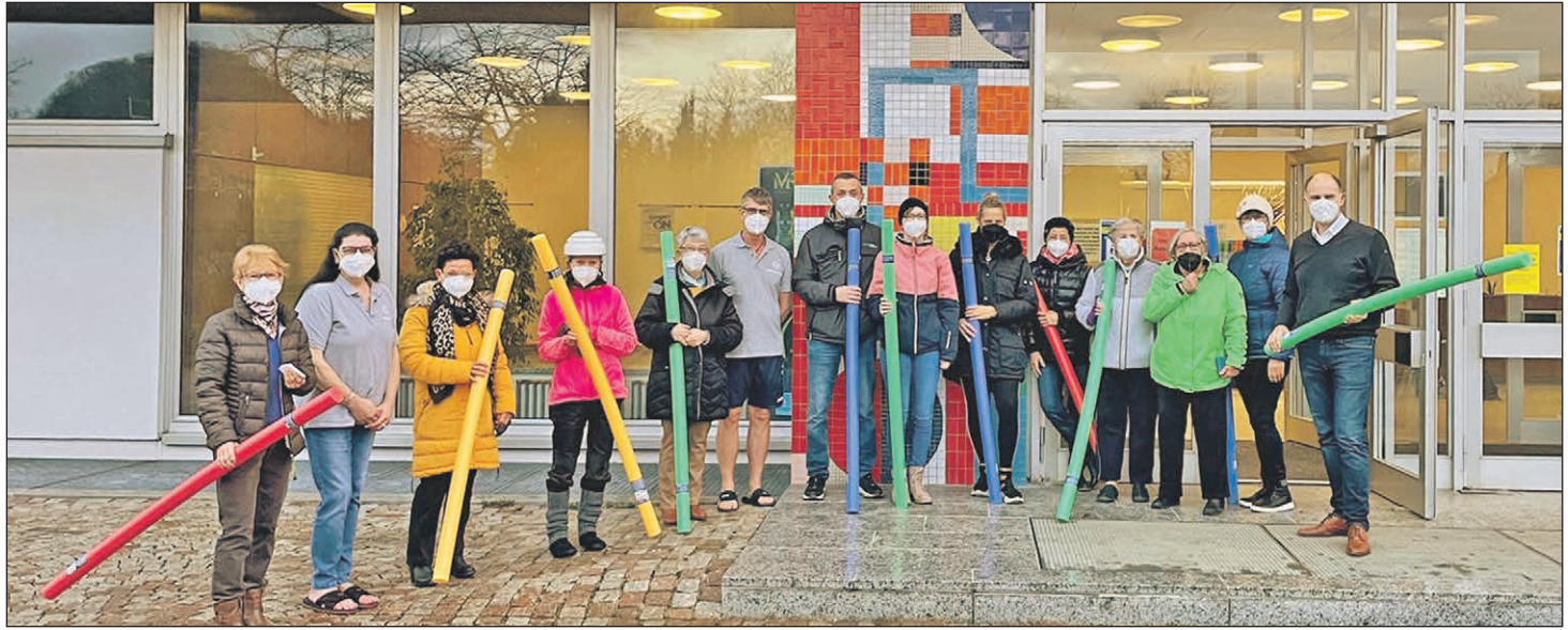
Zum 50-jährigen Geburtstag des Singener Hallenbades verteilte auch Oberbürgermeister Bernd Häusler (rechts) einige Präsente (Poolnudeln und Zehnerkarten) an die Badegäste. Eine größere Veranstaltung konnte aufgrund der Corona-Situation leider nicht stattfinden, das soll aber im Laufe des Jahres nachgeholt werden. Zumindest fanden an diesem Tag kleinere Wettkämpfe statt, bei denen Gewinne für die Teilnehmerinnen und Teilnehmer winkten.