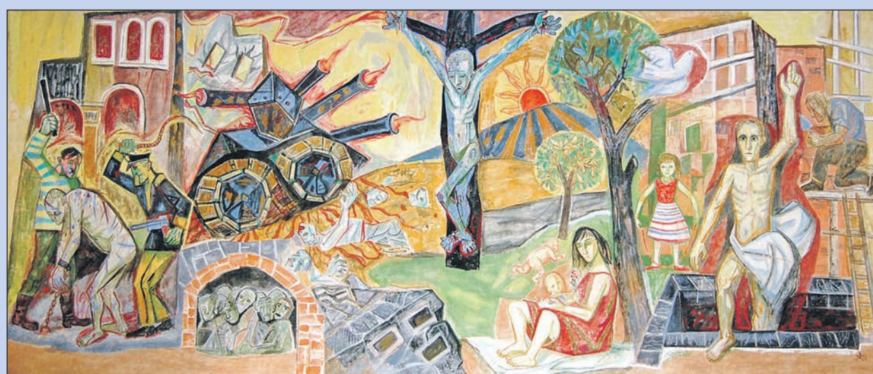
Das Wandbild „Krieg und Frieden“ von Otto Dix im Ratssaal des Singener Rathauses kann an allen Samstagen und Sonntagen vom 27. Mai bis zum 10. September 2023 besichtigt werden.

Dix in der NS-Zeit und im 2. Weltkrieg verloren gingen, ist einzig das Wandbild im Singener Rathaus erhalten geblieben – ein für die Nachkriegsmoderne exemplarisches, geschichtlich und künstlerisch spannendes Werk.