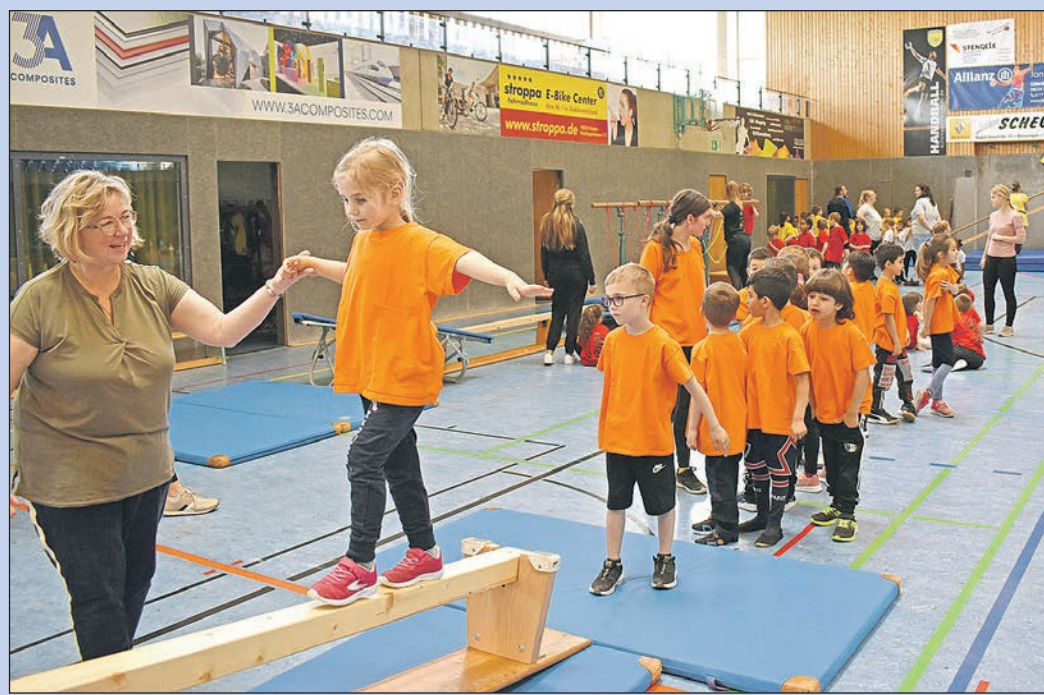
Klettern, Schwingen, Hangeln, Balancieren – mit viel Spaß und großem Eifer nahmen rund 180 Vorschulkinder am Sport-Tag aller städtischen elf Kindertagesstätten in der Singener Münchriedhalle teil. Zum Abschluss des „bewegten“ Tages gab es für die jungen Leute belegte Brötchen zur Stärkung.